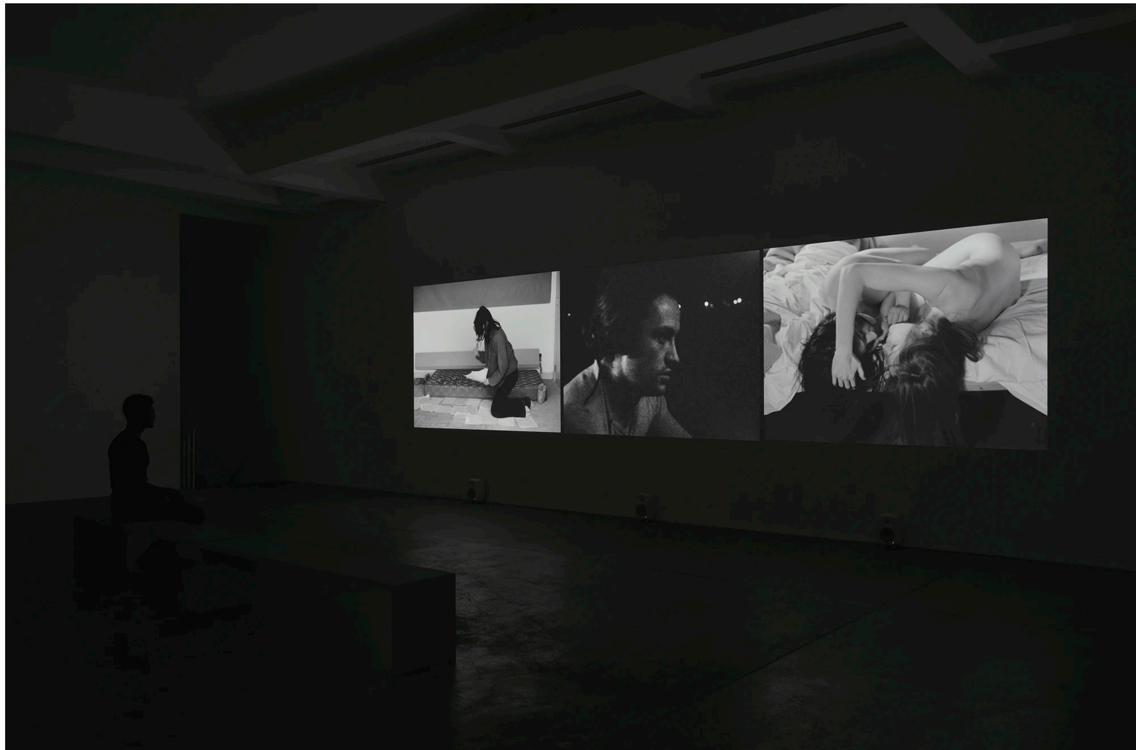
Chantal AKERMAN, Je, tu, il, elle, l'installation, 2007, multi projection vidéo sonore, 60 min en boucle, vue de l'installation à la galerie Marian Goodman, 2021