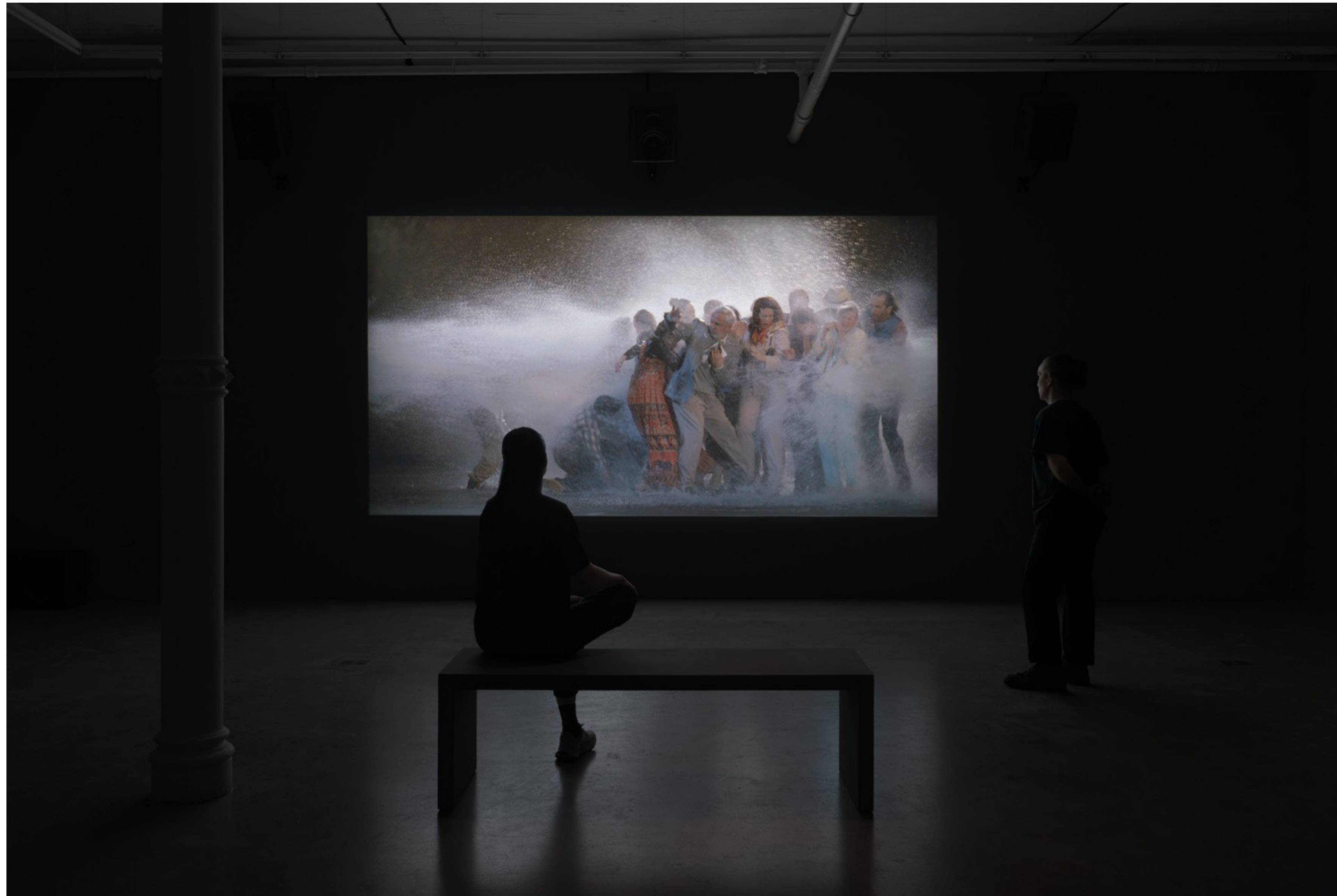
Bill VIOLA, The Raft, 2004, installation vidéo. La vidéo ralentie étire, dilate la scène et en renforce l'intensité dramatique. Le récit devient une expérience sensorielle pour le spectateur.