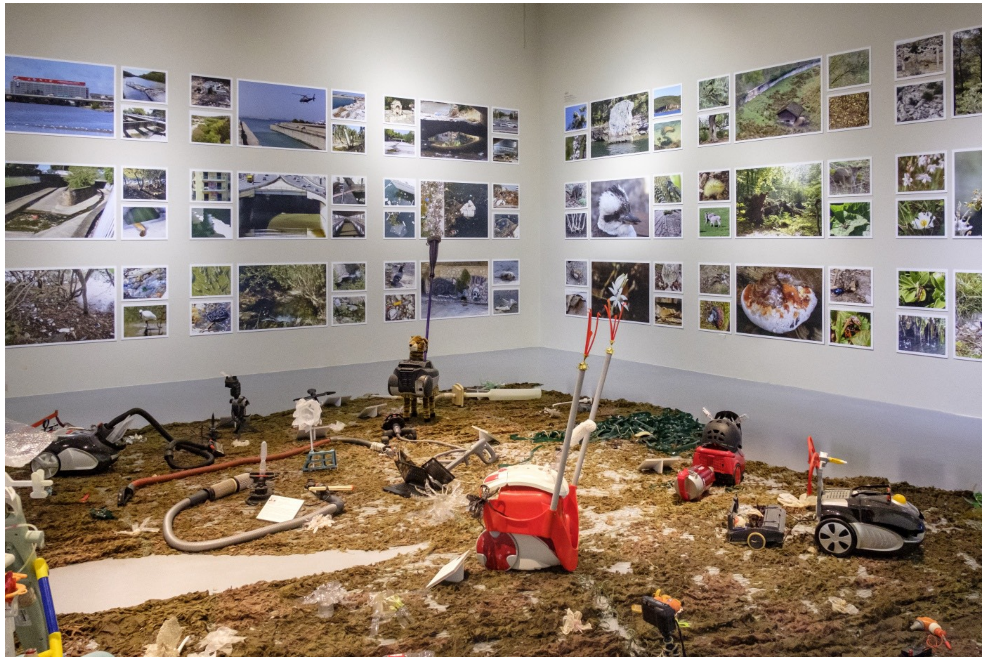
Forensic Architecture, vue de l'installation « Centre for Contemporary Nature » (2019), exposition « Plasticity of the Planet » Château d'Ujazdowski - Centre d'art contemporain à Varsovie