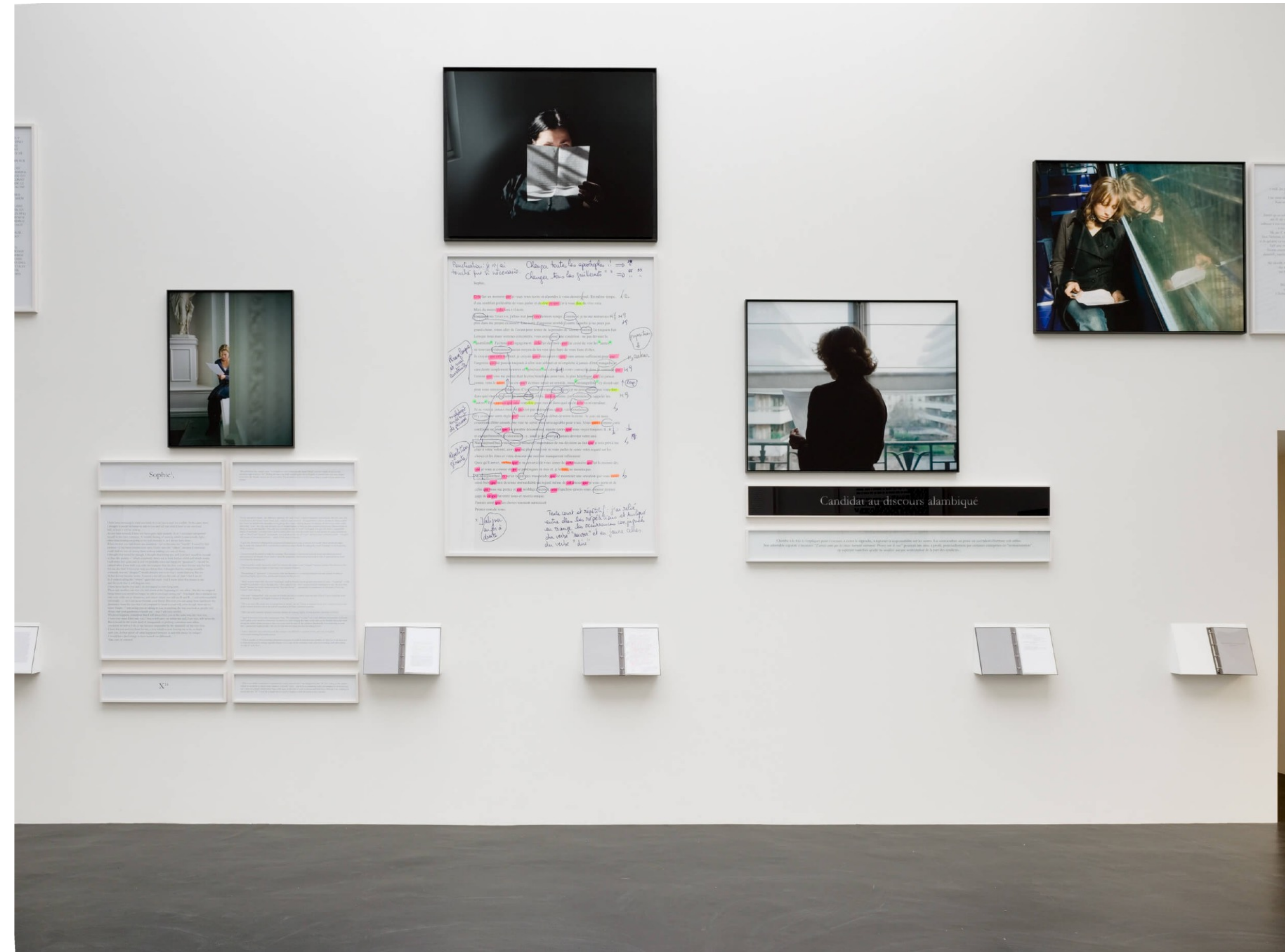
Sophie CALLE, Vue de l'exposition Sophie Calle « Prenez soin de vous », au Pavillon français de la 52e Biennale de Venise, 2007