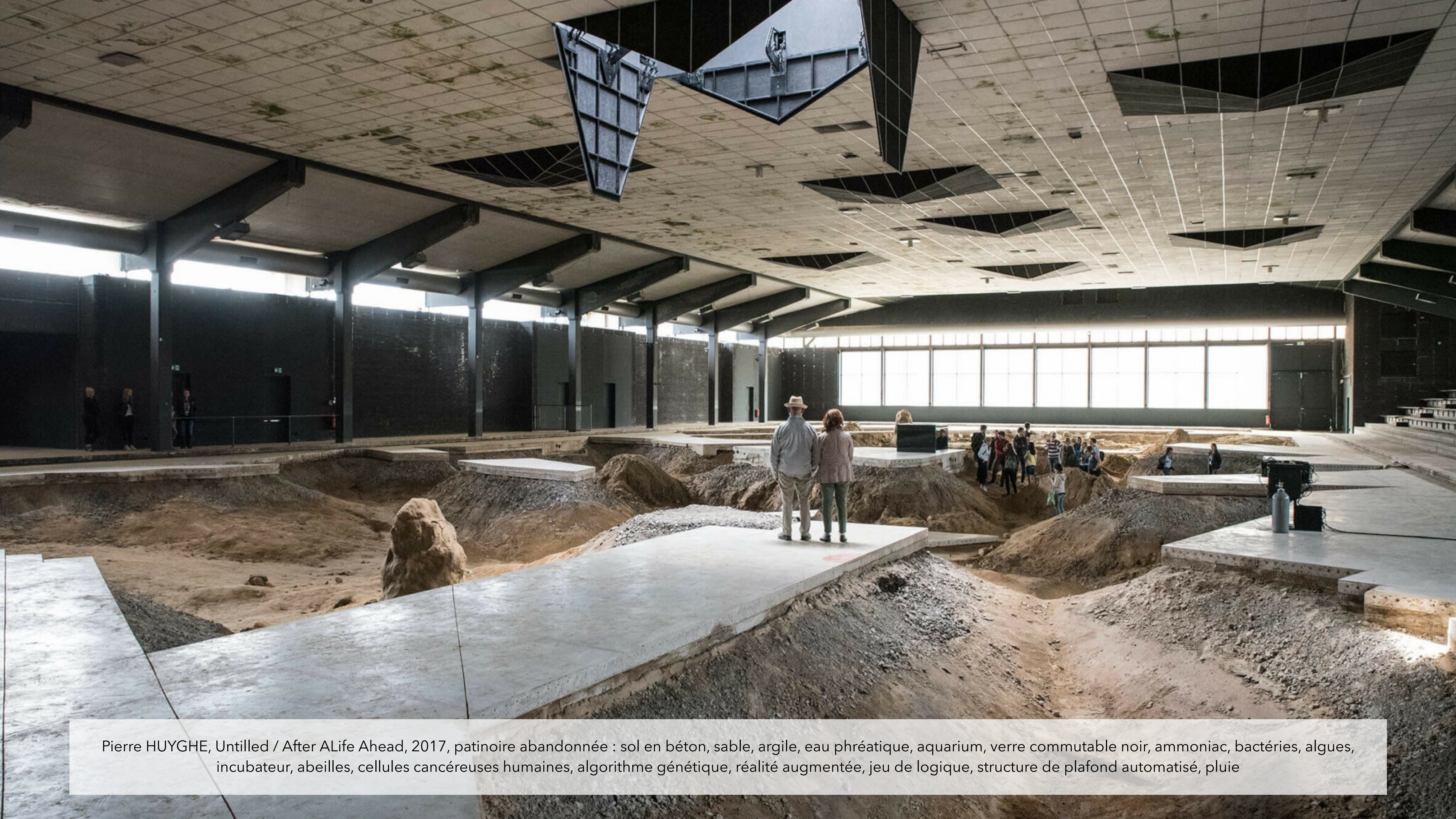
Pierre HUYGHE, Untilled / After ALife Ahead, 2017, patinoire abandonnée : sol en béton, sable, argile, eau phréatique, aquarium, verre commutable noir, ammoniac, bactéries, algues, incubateur, abeilles, cellules cancéreuses humaines, algorithme génétique, réalité augmentée, jeu de logique, structure de plafond automatisé, pluie