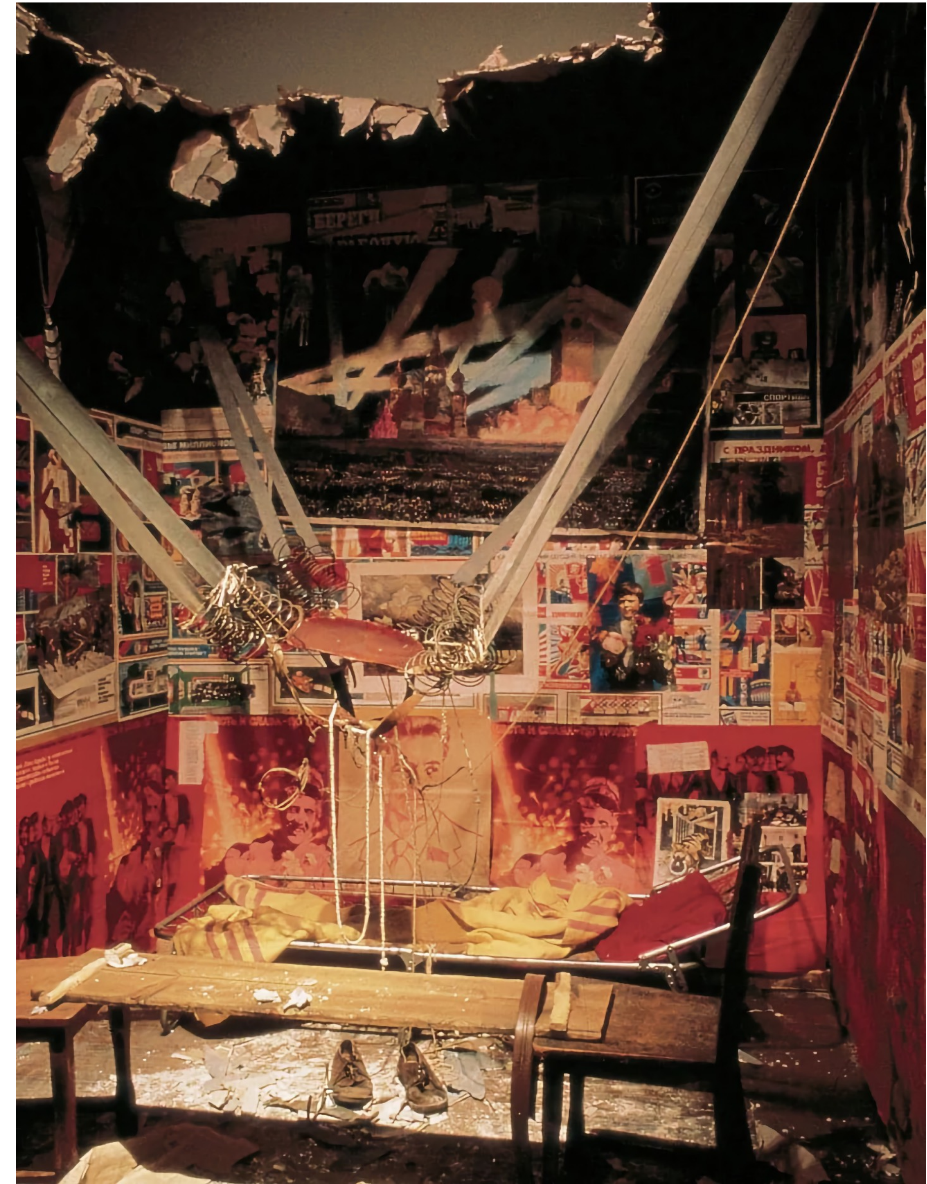
Ilya KABAKOV, The Man Who Flew Into Space from His Apartment, 1985, installation, bois, caoutchouc, cordes, papiers, lampe électrique, vaisselle, maquette, gravats et poussière de plâtre, 280 x 242 x 613 cm, Centre Pompidou