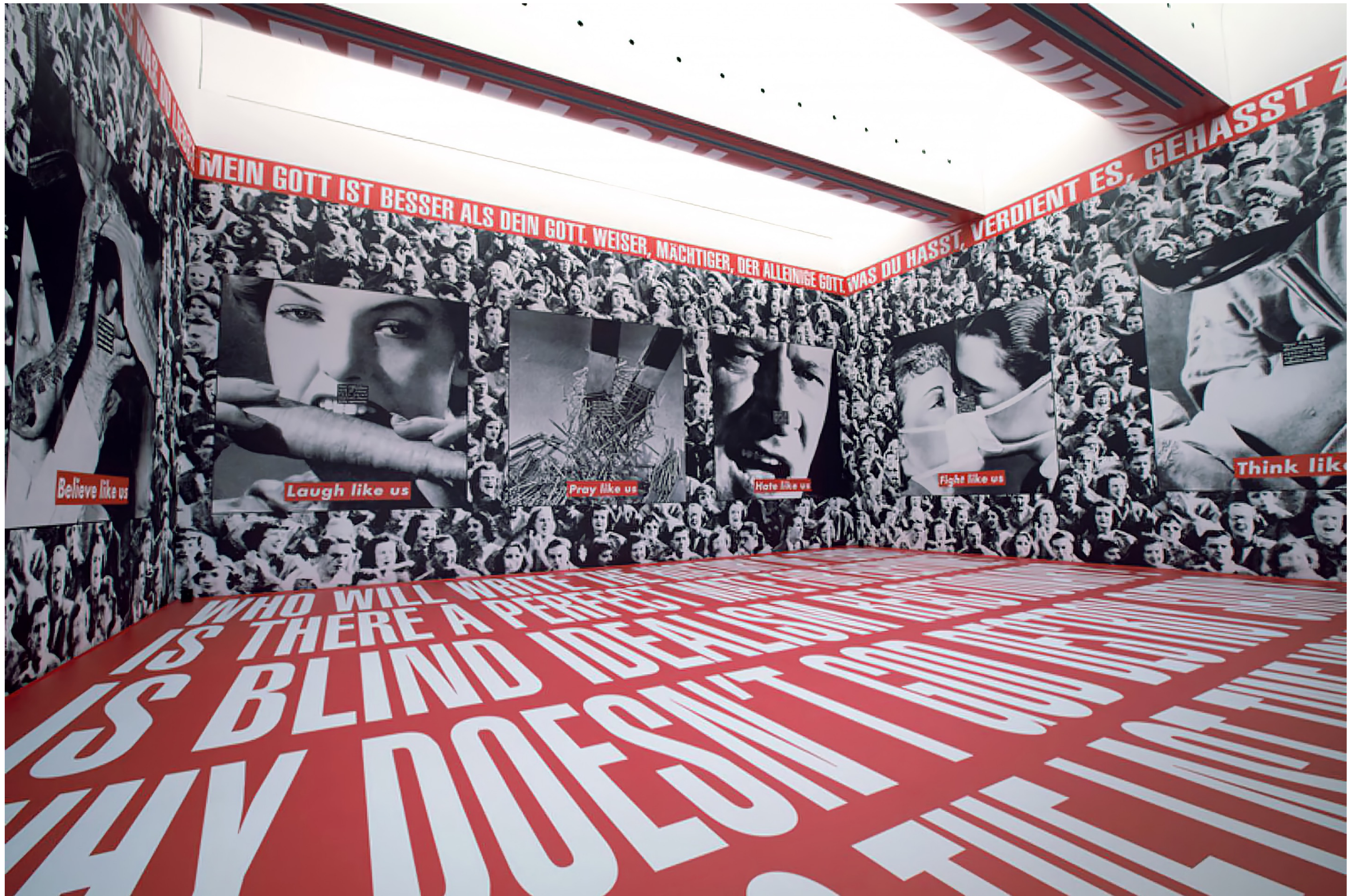
Barbara KRUGER, Untitled, 1994-1995, collage et sérigraphie sur papier et métal, Museum Ludwig Köln