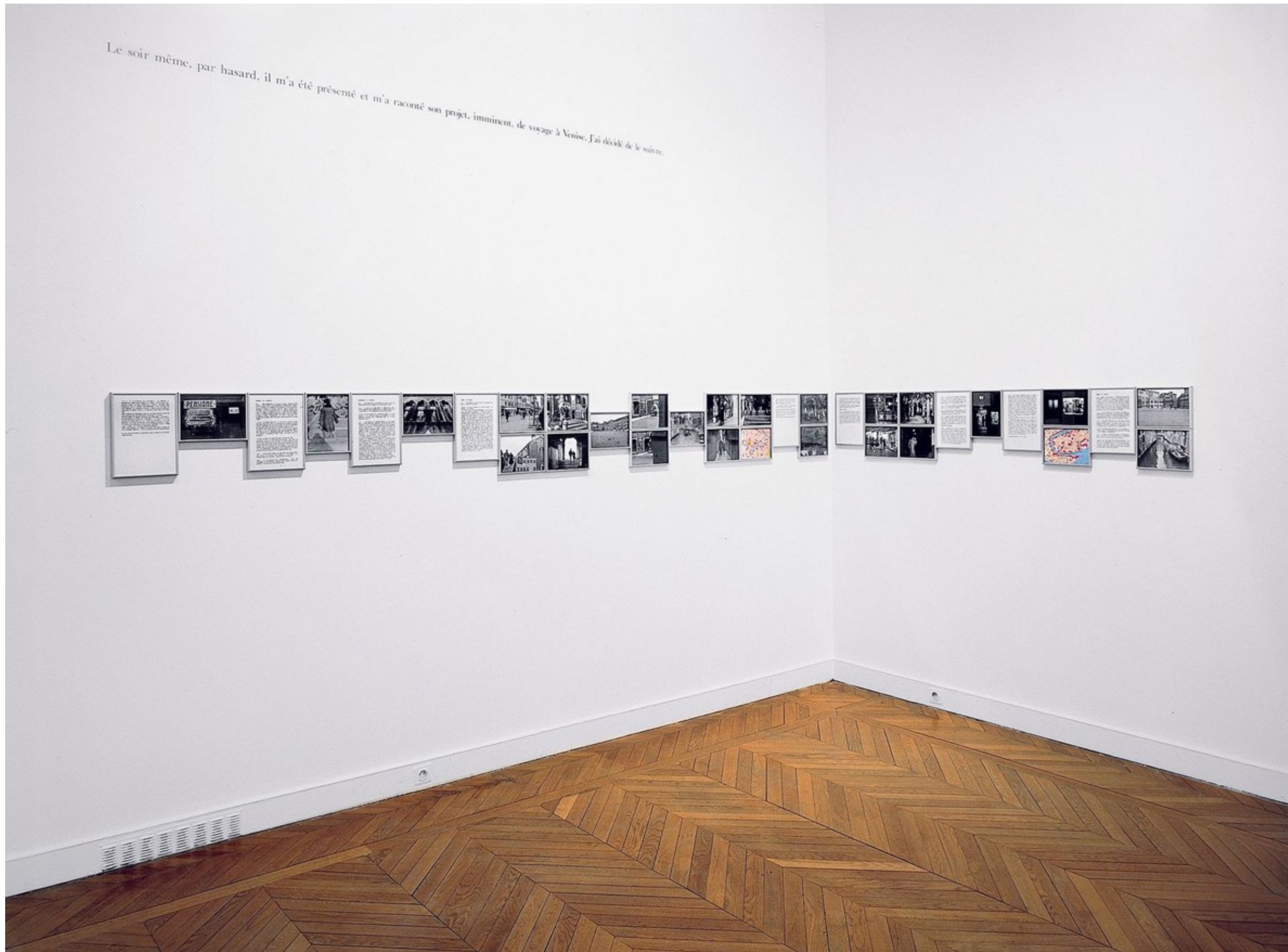
Sophie CALLE, Suite vénitienne, 1980-1994, installation, 55 photographies noir et blanc, trois plans de ville, 23 textes, Coll. Mudam, Luxembourg