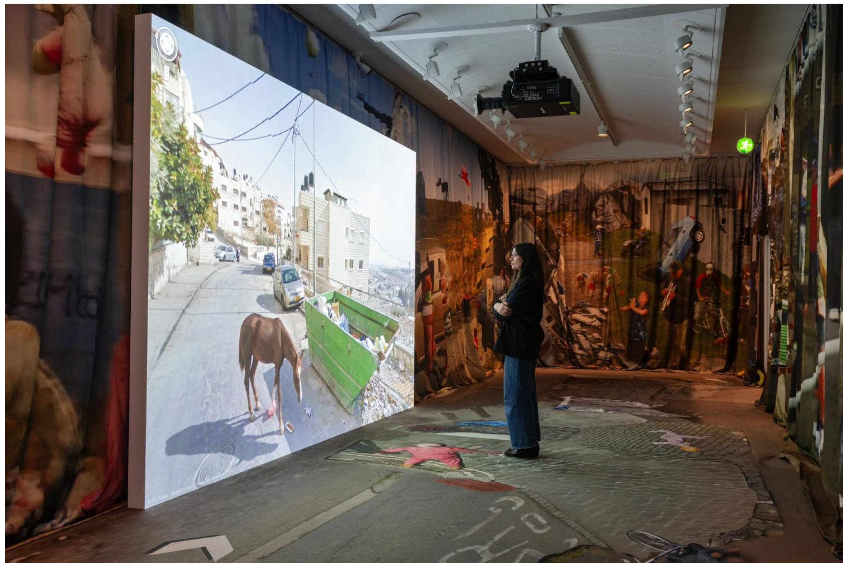
Jon RAFMAN, 9 Eyes, photographies captées par une voiture Street View Google, vue de l'exposition « Report a concern - The Nine Eyes Archives » (2025), Louisiana Museum of Modern Art