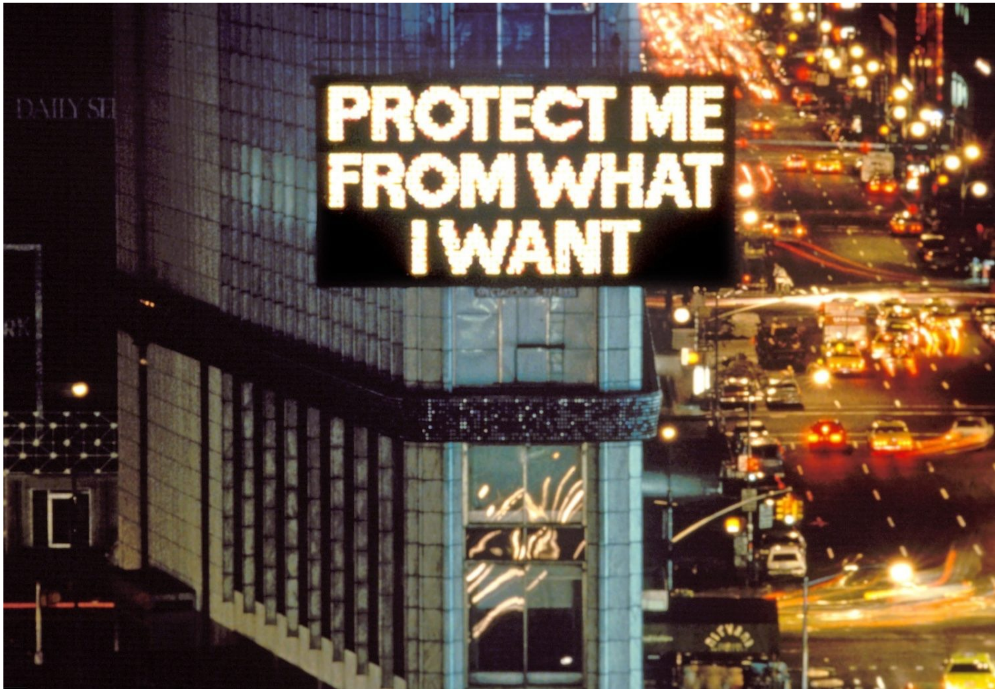
Jenny HOLZER, Protect me from what I want, de la série Survival (1983-85), 1985, panneau électronique, 6,1 x 12,2 m, Times Square, New York