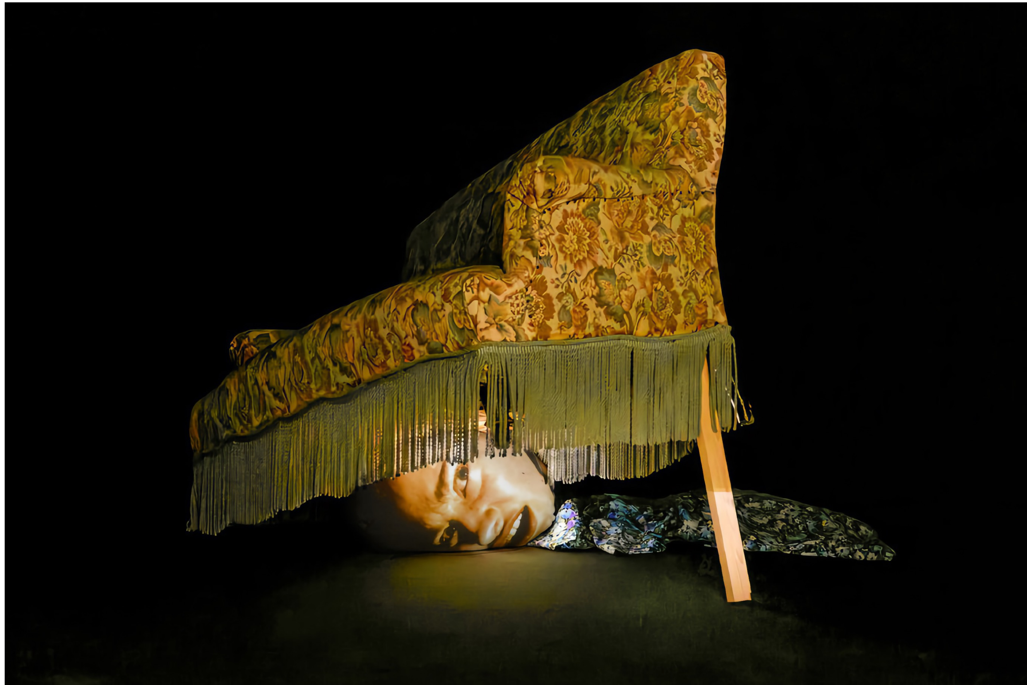
Tony OURSLER, Couch Piece, 1995, installation multimédia, canapé, coussin de coton, robe synthétique imprimée, videoprojecteur, système son, 210 x 240 cm