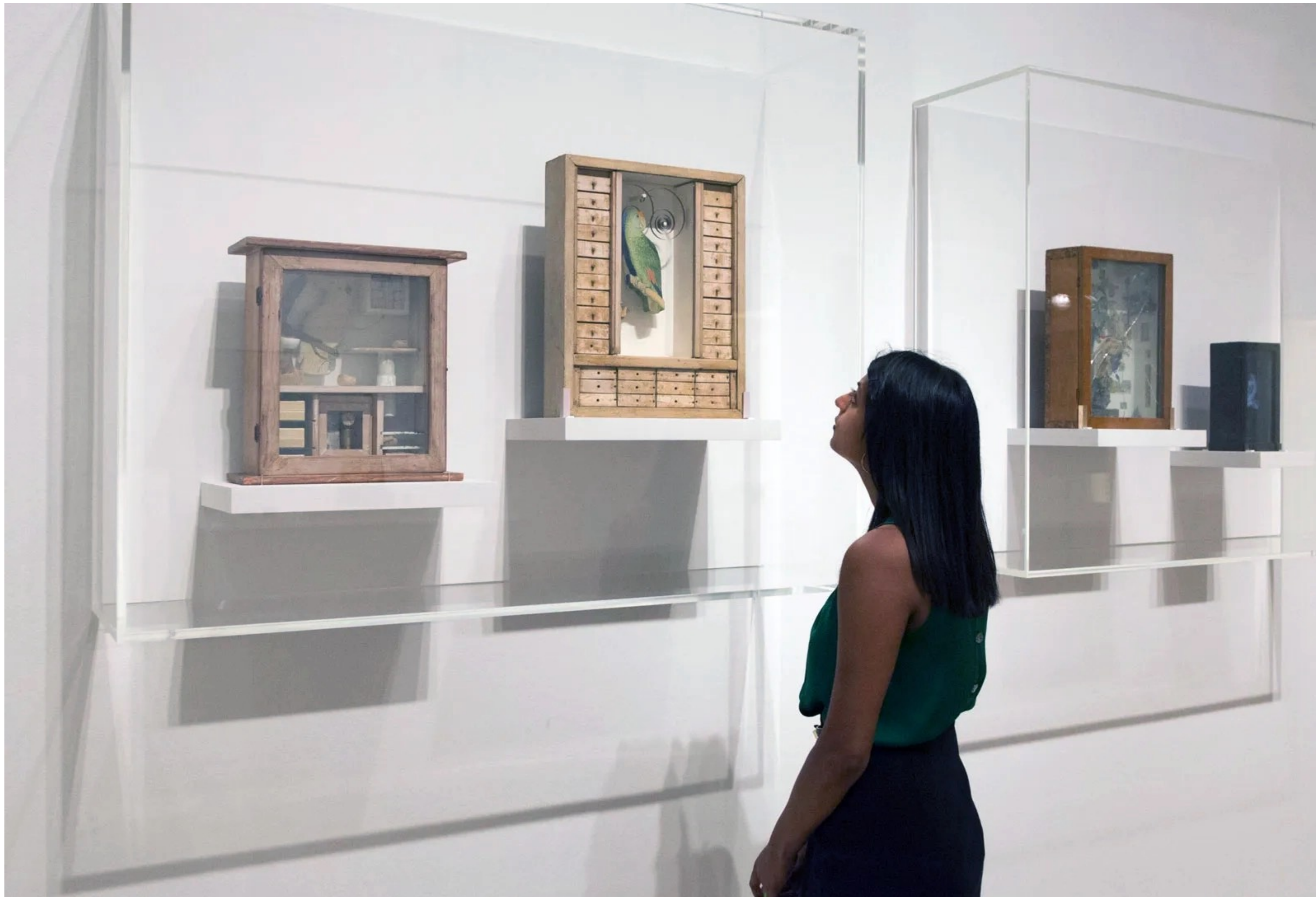
Joseph CORNELL, vue de l'exposition « Joseph Cornell's shadow boxes » à la Royal Academy of Arts, Londres, 2015