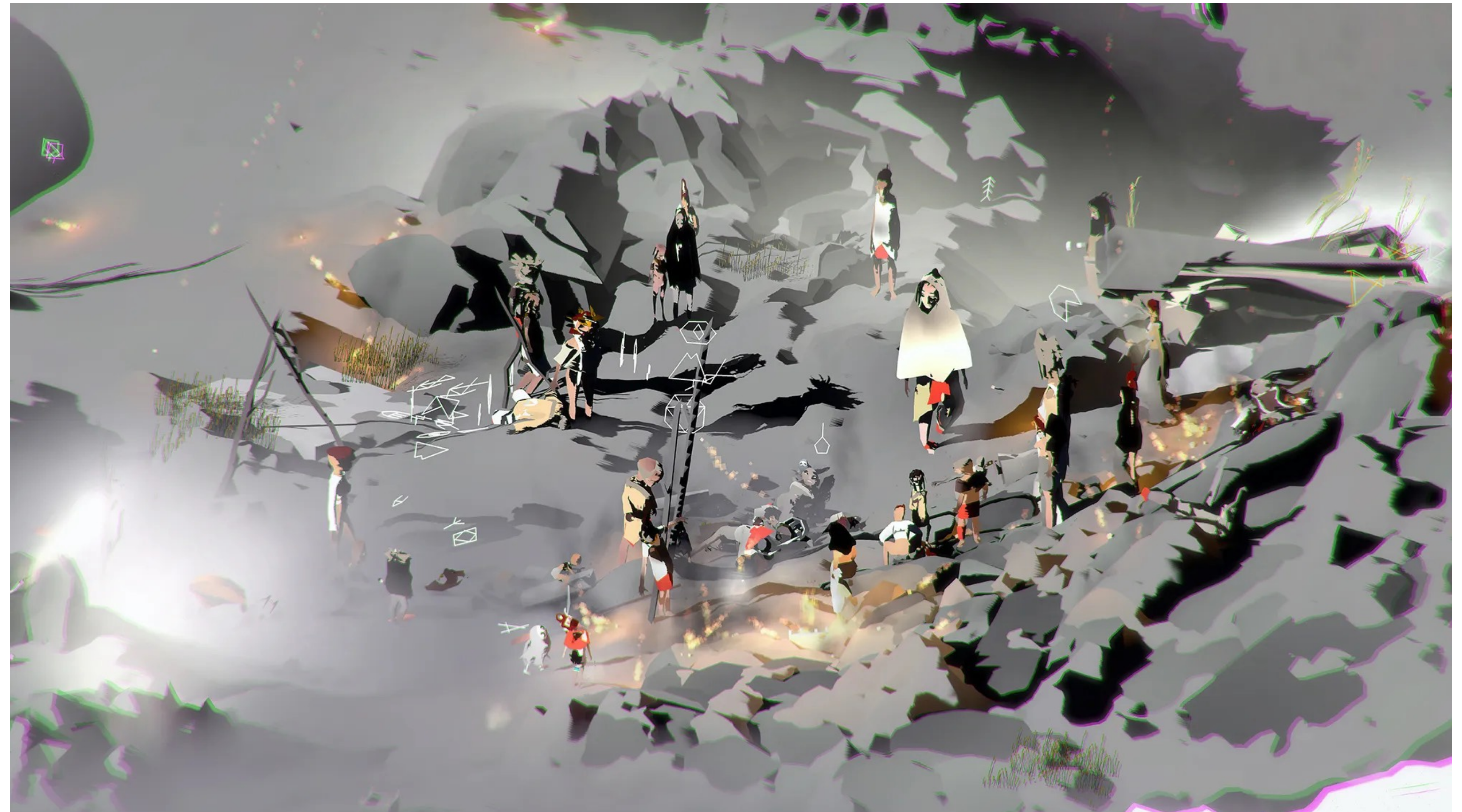
Ian CHENG, Emissaries, 2015-2017, trilogie de simulations numériques , projections immersives, Serpentine Gallery (2018), Londres

https://www.moma.org/calendar/exhibitions/3656