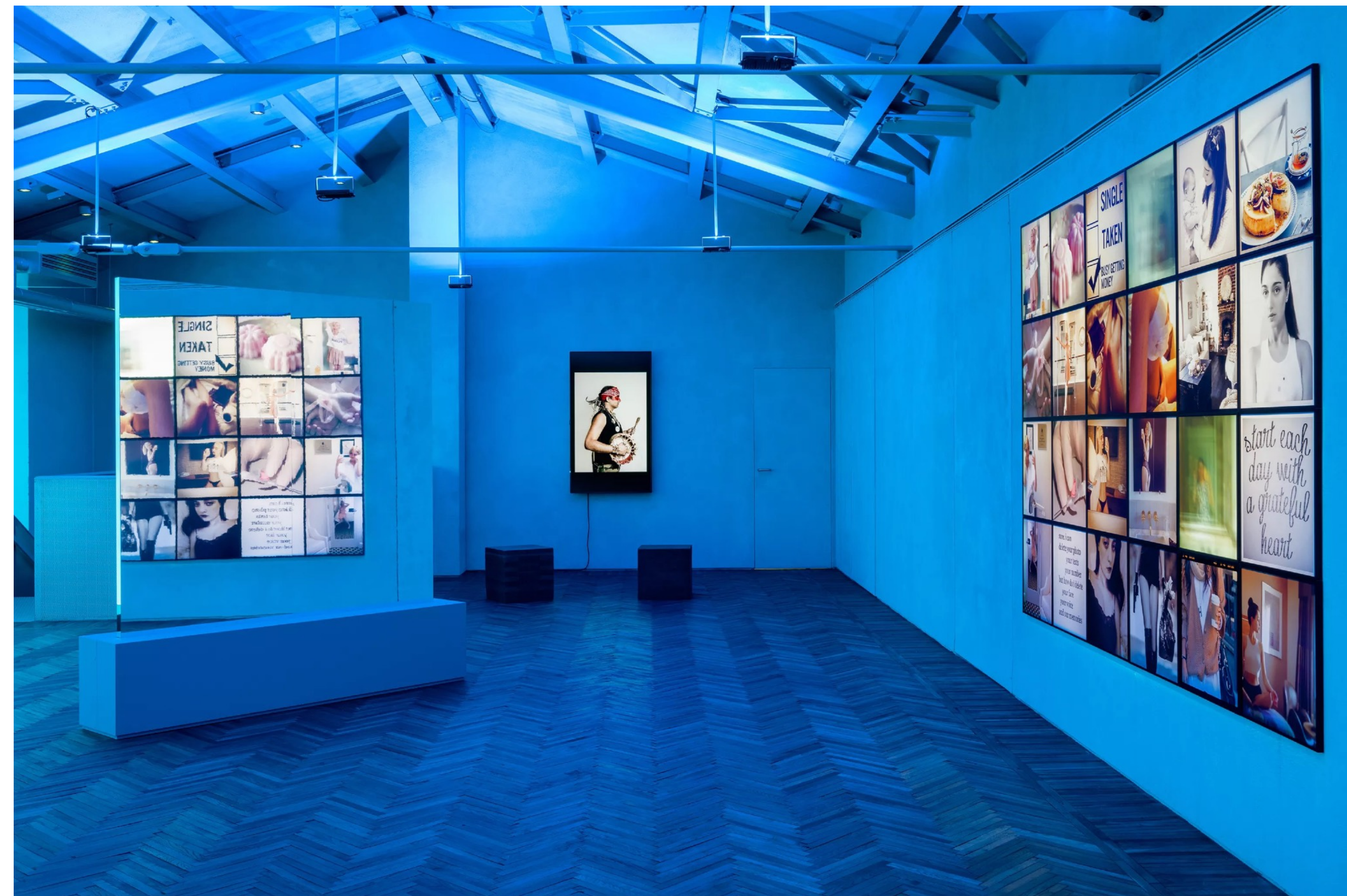
Amalia ULMAN, Roleplay, 2022, vue de l'installation, Fondazione Prada, Milan