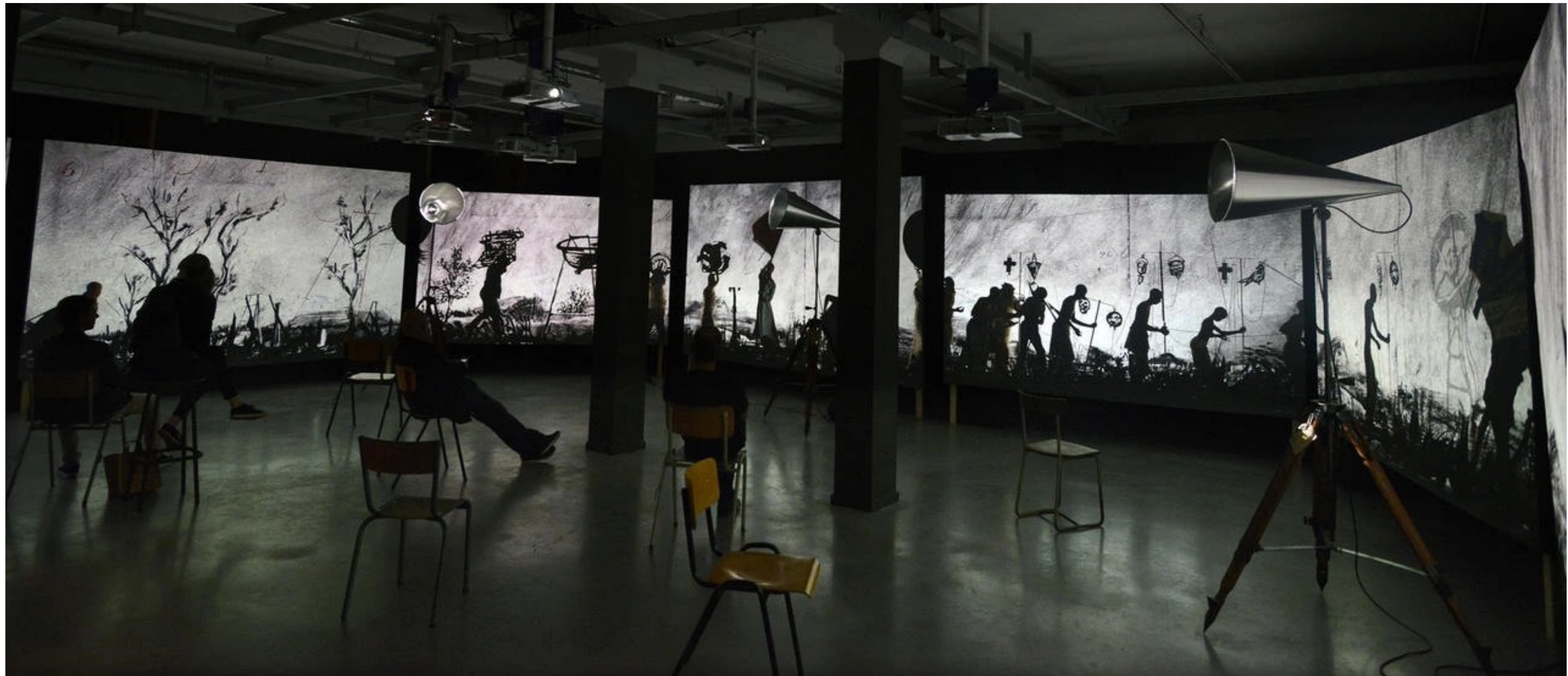
William KENTRIDGE, More Sweetly Play the Dance, 2015, installation, vidéo 8 canaux haute définition, 15 min, avec quatre porte-voix, chaises et tabourets, dimensions variables