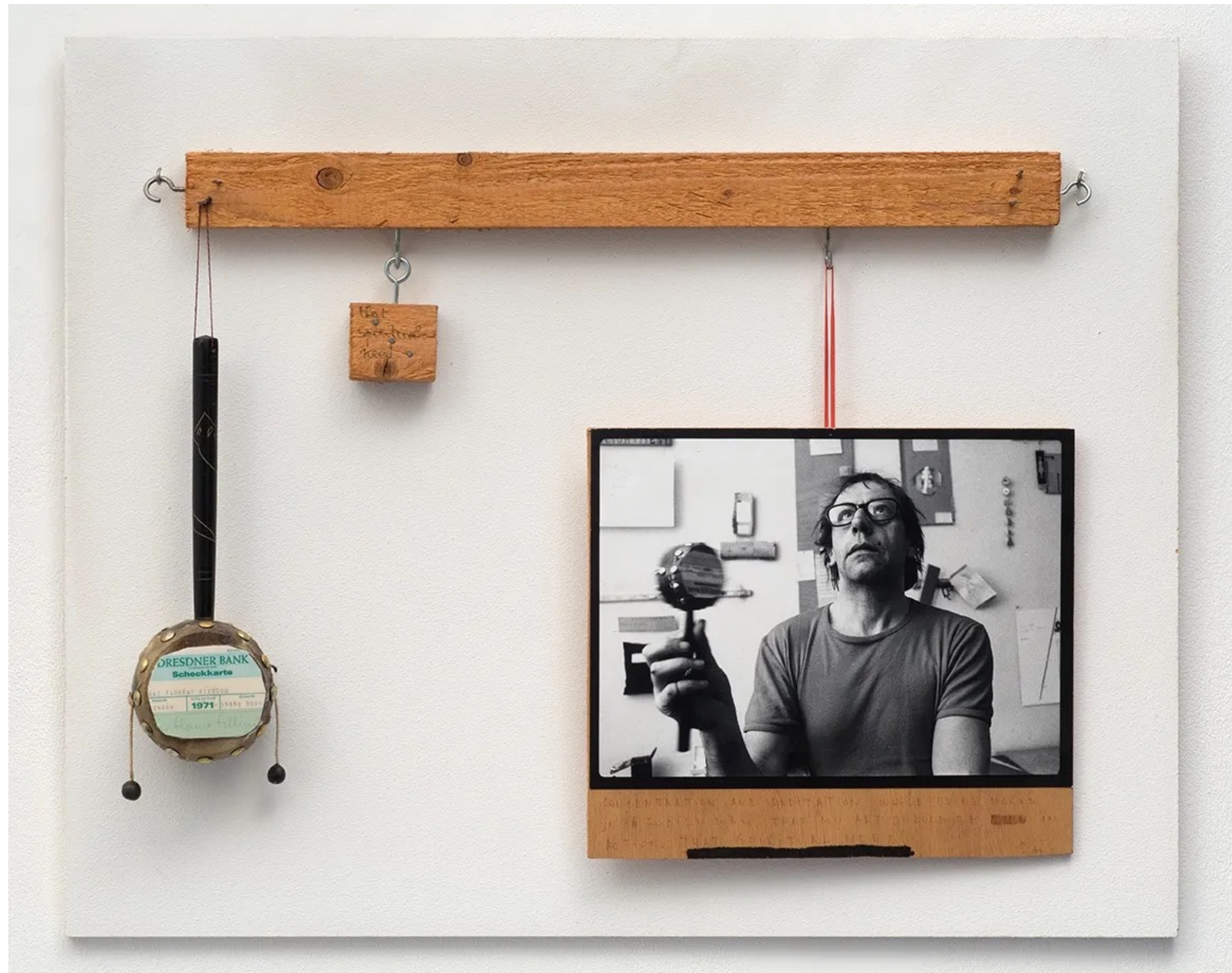
Robert FILLIOU, That Spiritual Need, 1971, bois, clous, vis, photographie en noir et blanc et tabor avec carte bancaire sur panneau en bois, 55,5 × 68,5 × 7 cm