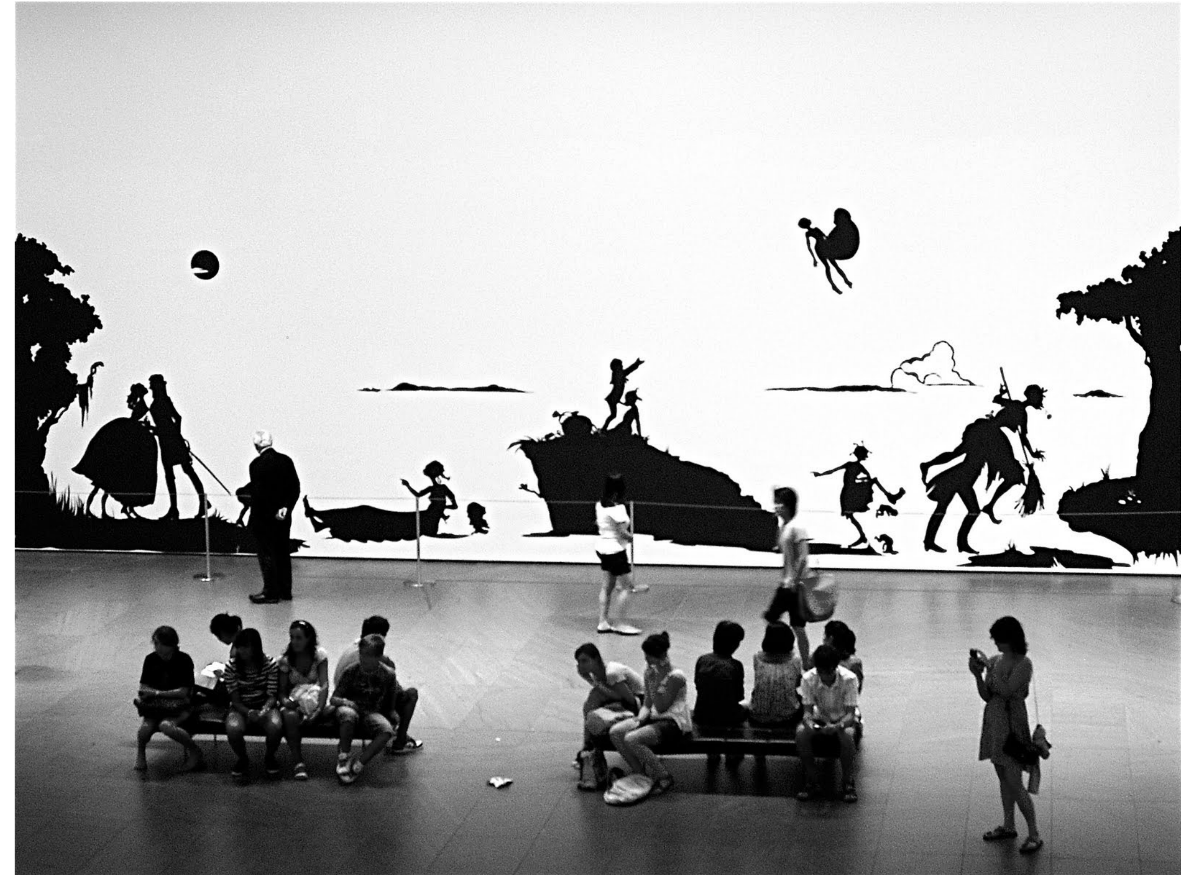
Kara WALKER, Gone: An Historical Romance of a Civil War as it Occurred between the Dusky Thighs of One Young Negress and Her Heart , 1994