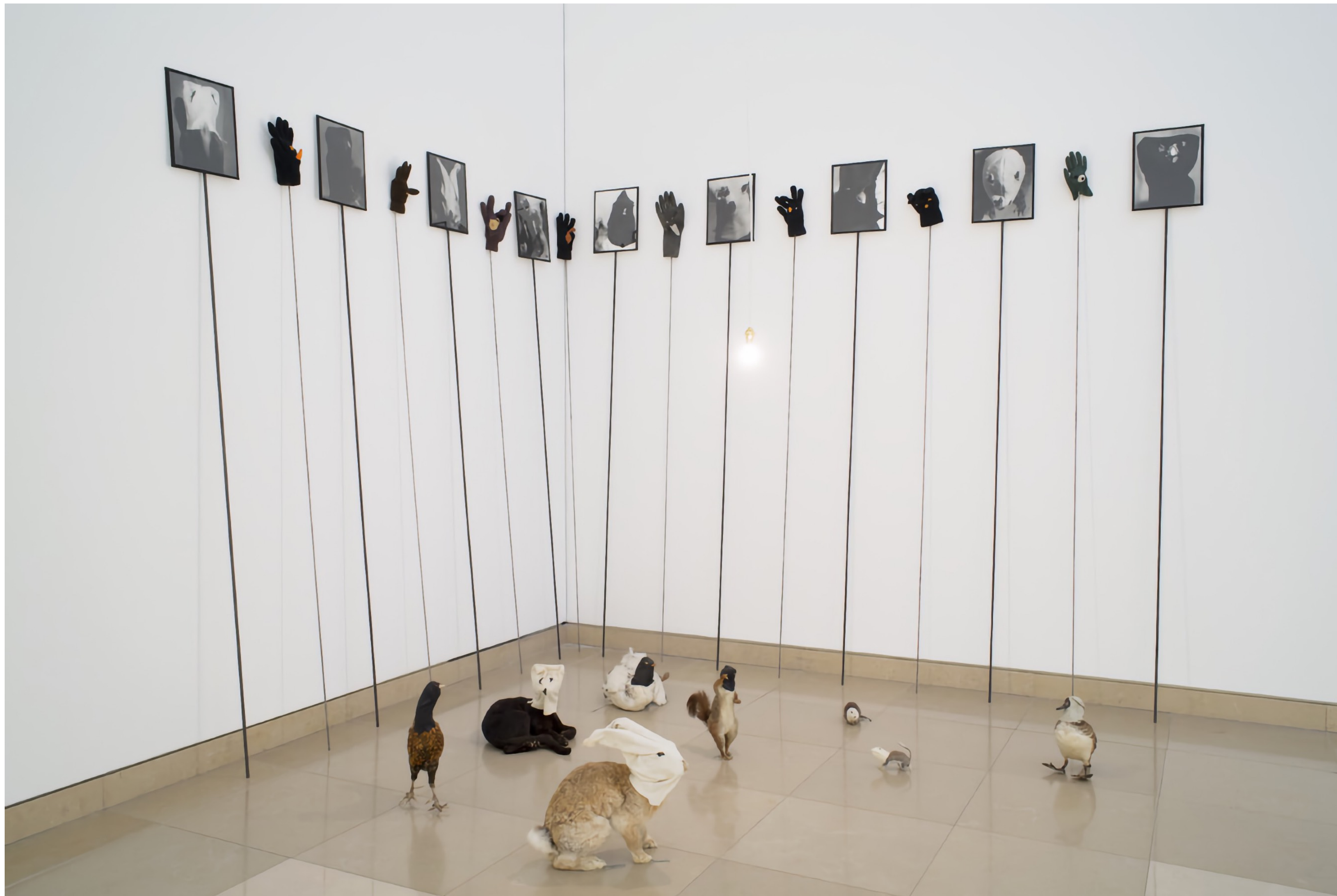
Annette MESSAGER, Sans titre, 1992, installation comportant au sol 9 animaux naturalisés portant une cagoule. 19 piques métalliques identiques sont adossées au mur, photographies, verre, métal, tissu, cuir, tricot, animaux naturalisés, 7 x 4 m