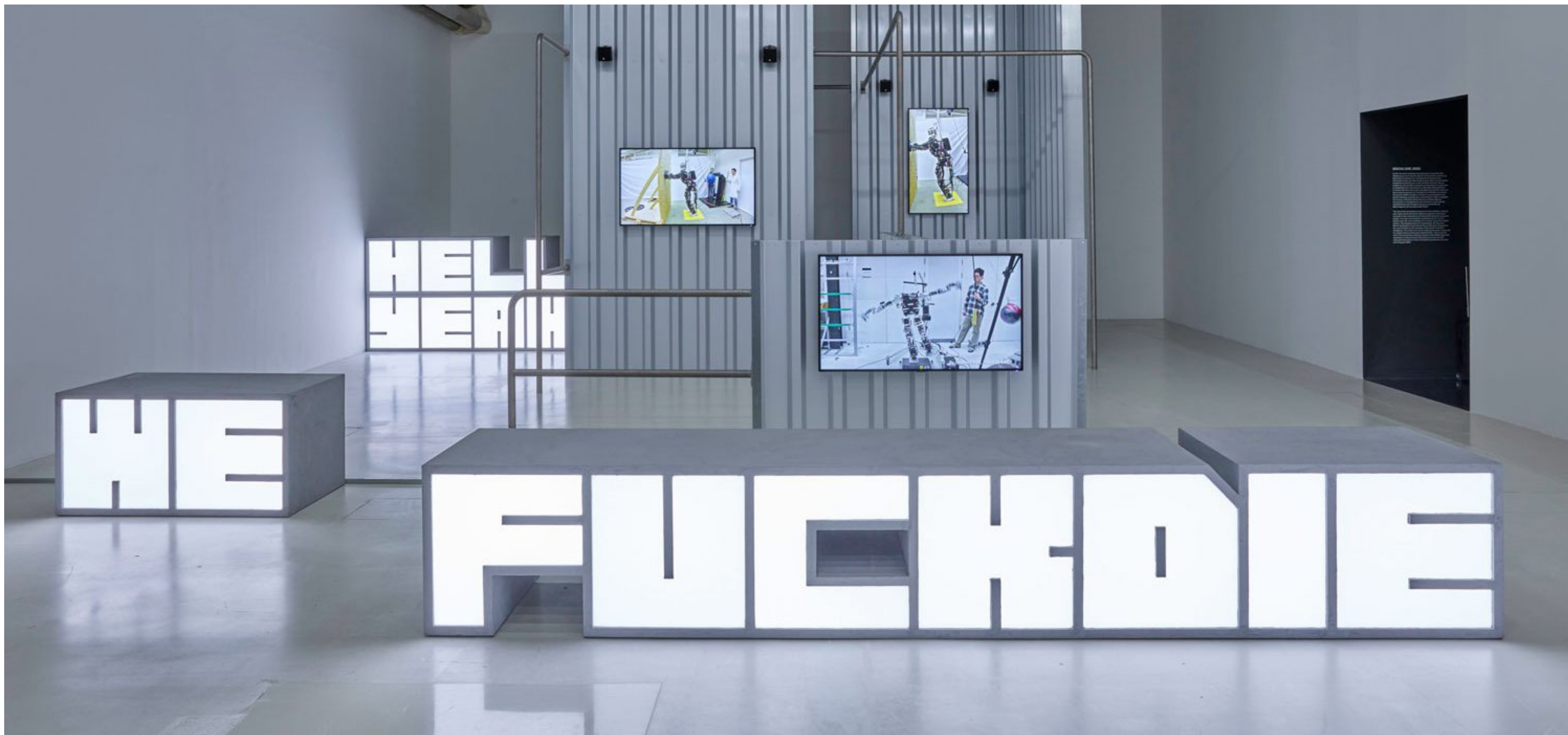
Hito STEYERL, vue de l'installation « Hell Yeah We Fuck Die » (2016) au Centre Pompidou, installation audiovisuelle : environnement architectural (caissons lumineux, structure métallique, tôles ondulées) et vidéo