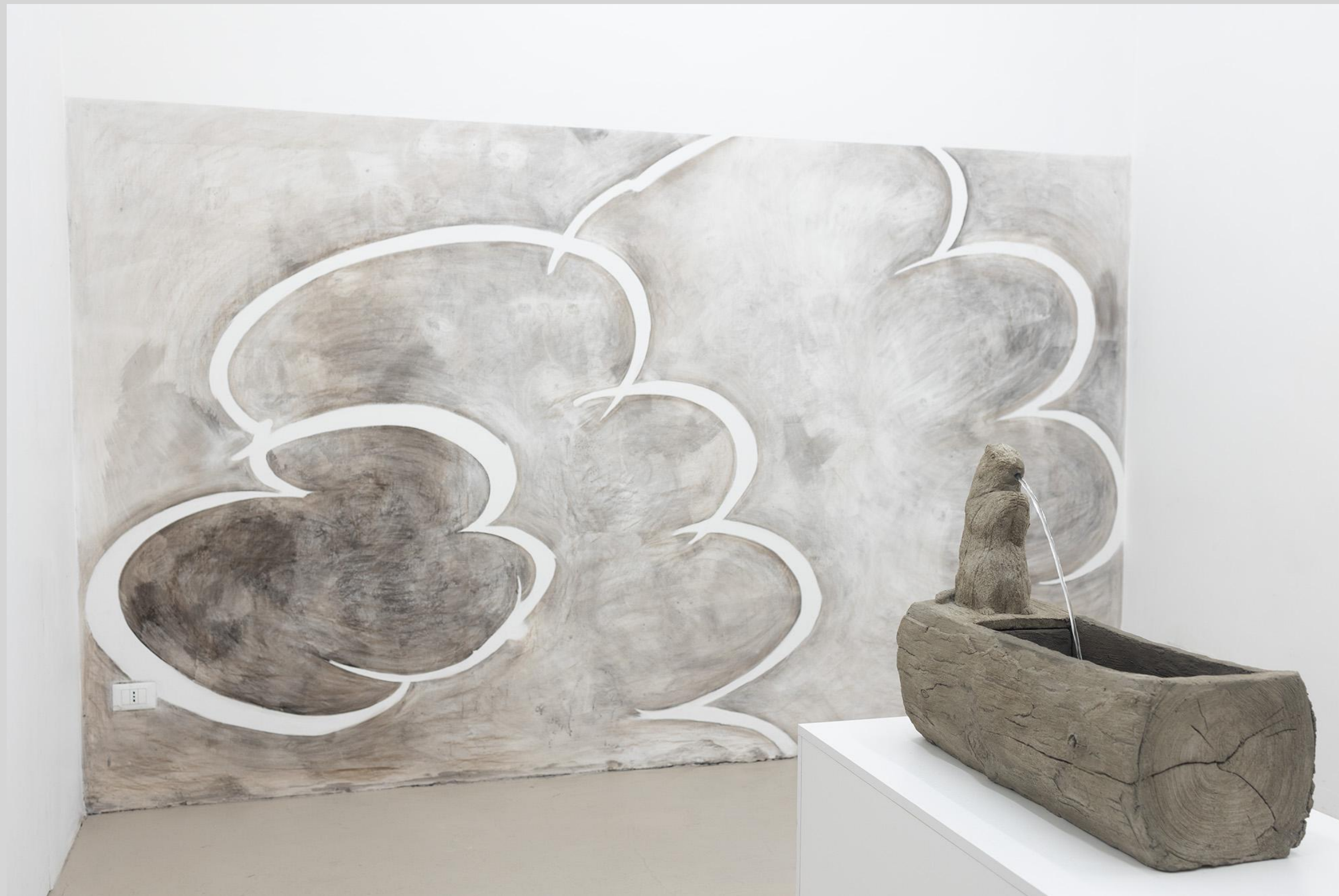
Marmotte , 2020, rustication/ faux-bois, pompe, 50 × 65 × 25 cm Sans titre , dessin mural au fusain Vue de l'exposition Marmott 2025 , Pianobi Arte Contemporanea, Rome – curatrice : Isabella Vitale