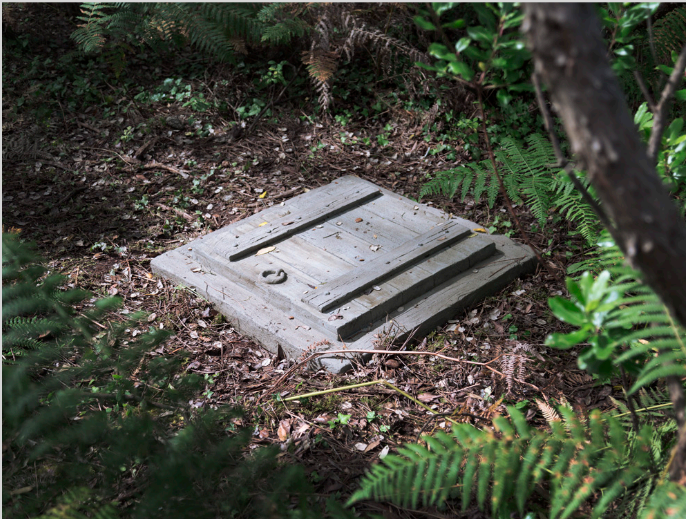
Exposition Beau futur (2022), parcours artistique, Théâtre de verdure, Labenne (Landes)