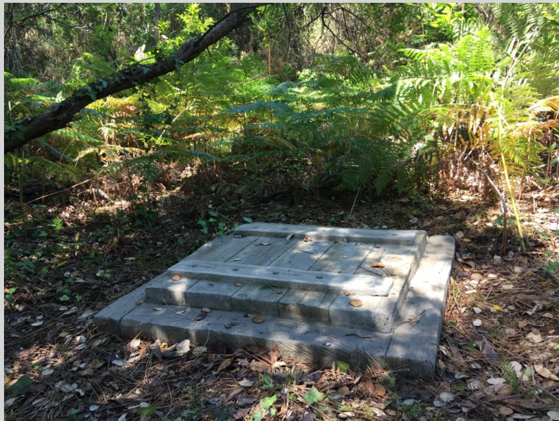
Exposition Beau futur (2022), parcours artistique, Théâtre de verdure, Labenne (Landes)