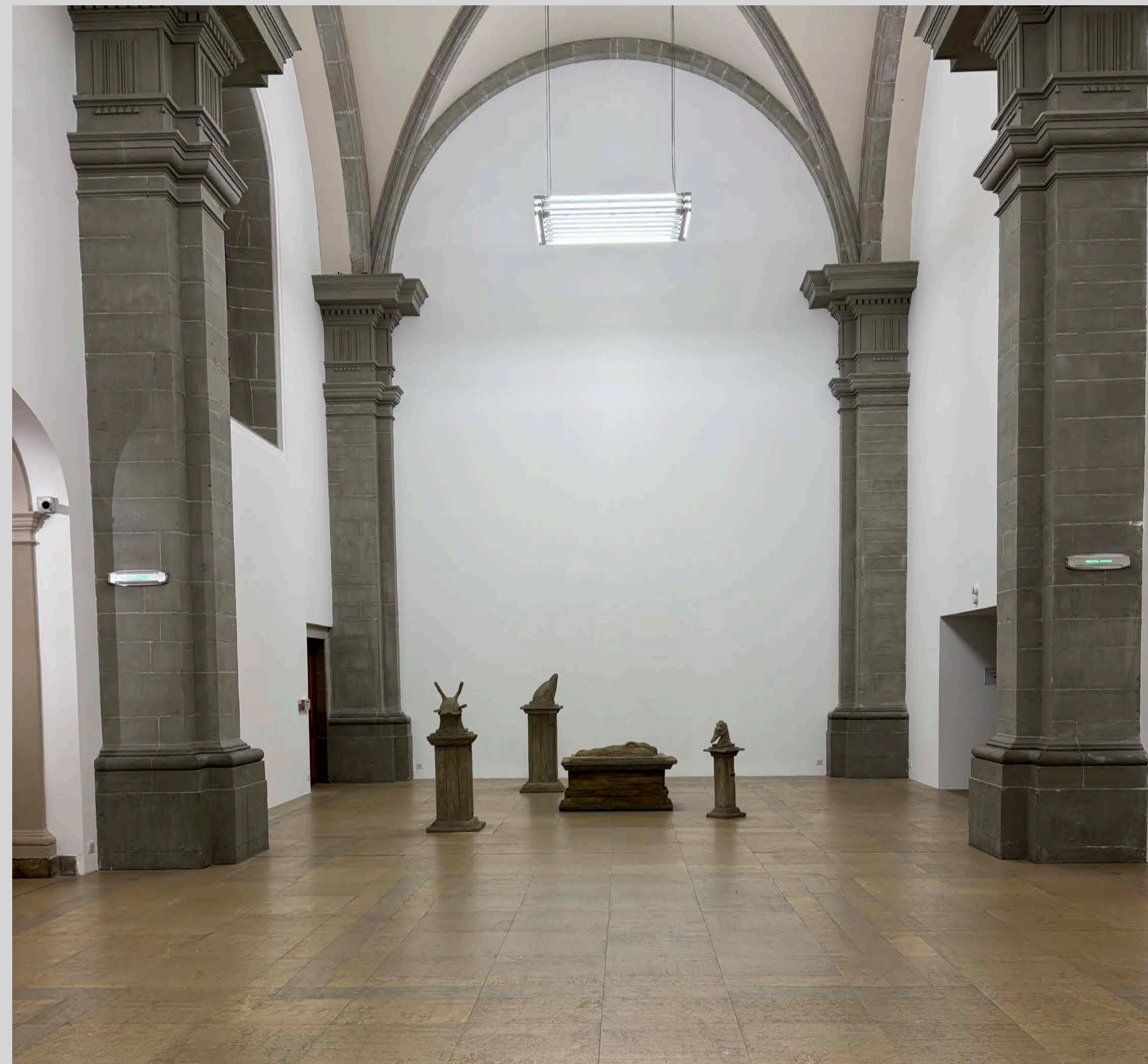
Vue de l'exposition Les Animaux , La Chapelle, Thonon-les-Bains – commissaire d'exposition : Philippe Piguet