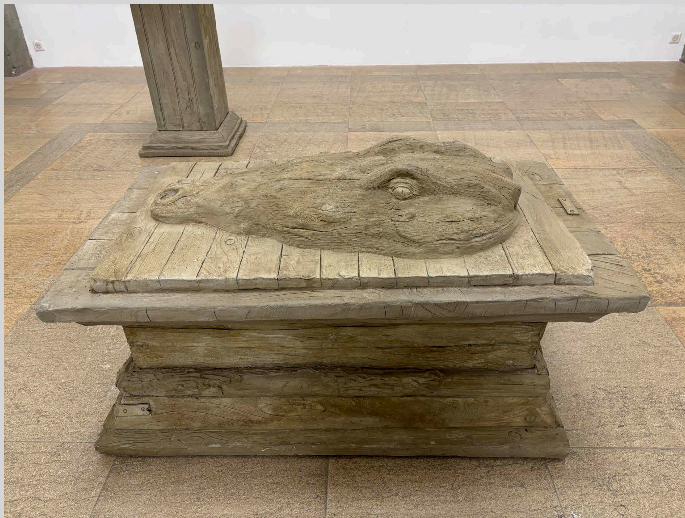
Crocodile , 2020, rustication/ faux-bois, 80 × 126 × 72 cm