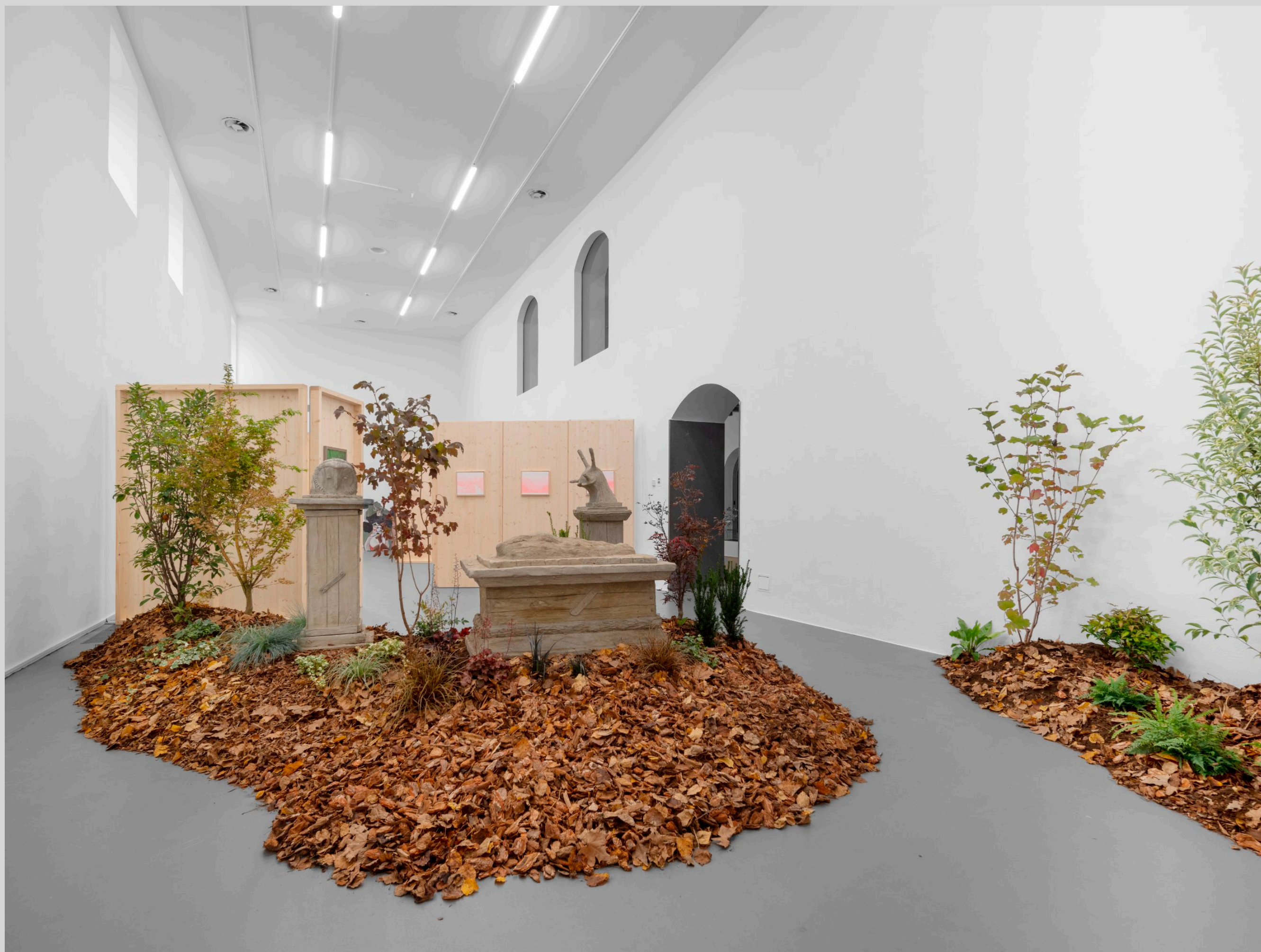
Vue de l'exposition Thinking Like a Mountain , dans le cadre de la Biennale Gherdëina, Galleria d'Arte Moderna e Contemporanea di Bergamo, Bergamo (Italie), 2024 – commissariat : Lucia Pietroiusti et Filipa Ramos