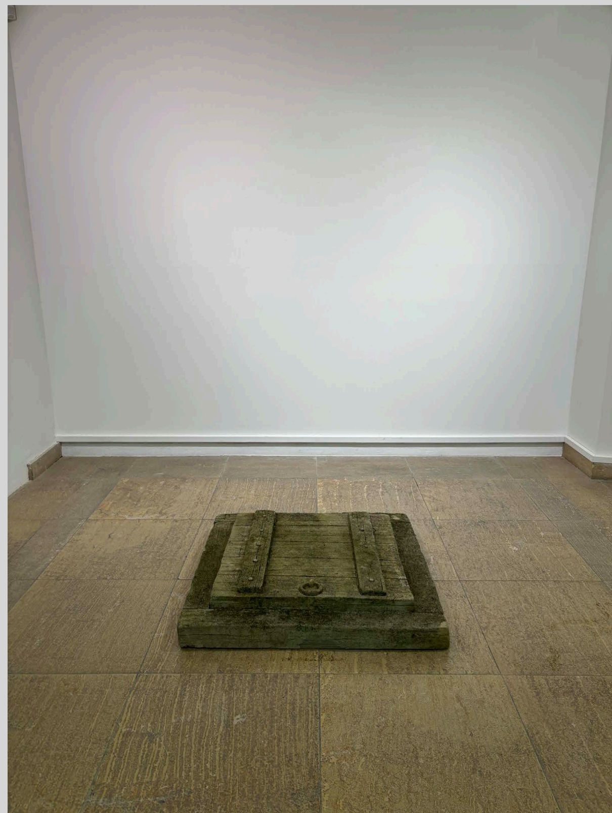
Trappe , 2003, rustication/ faux-bois, 90 × 90 × 12 cm, Installation à la Chapelle, Thonon-les-Bains