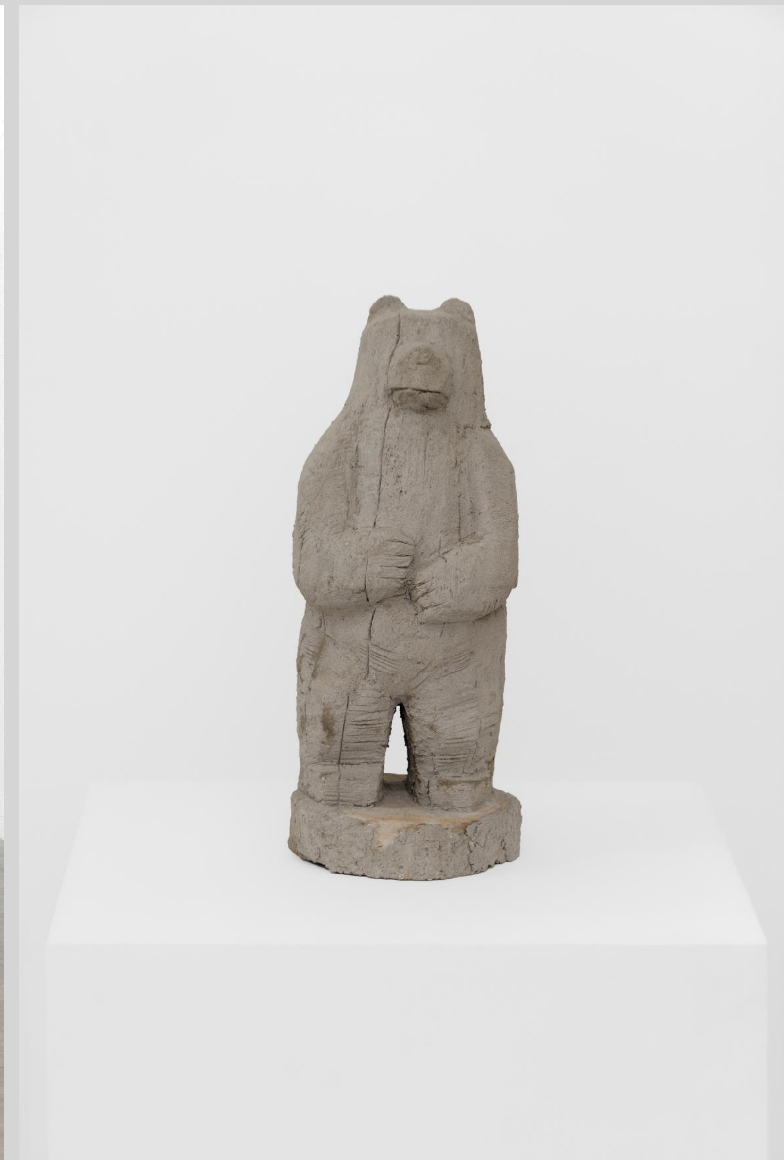
Ours aveugle , 2023, rusticage/ faux-bois, 34 × 14,5 × 14,5 cm