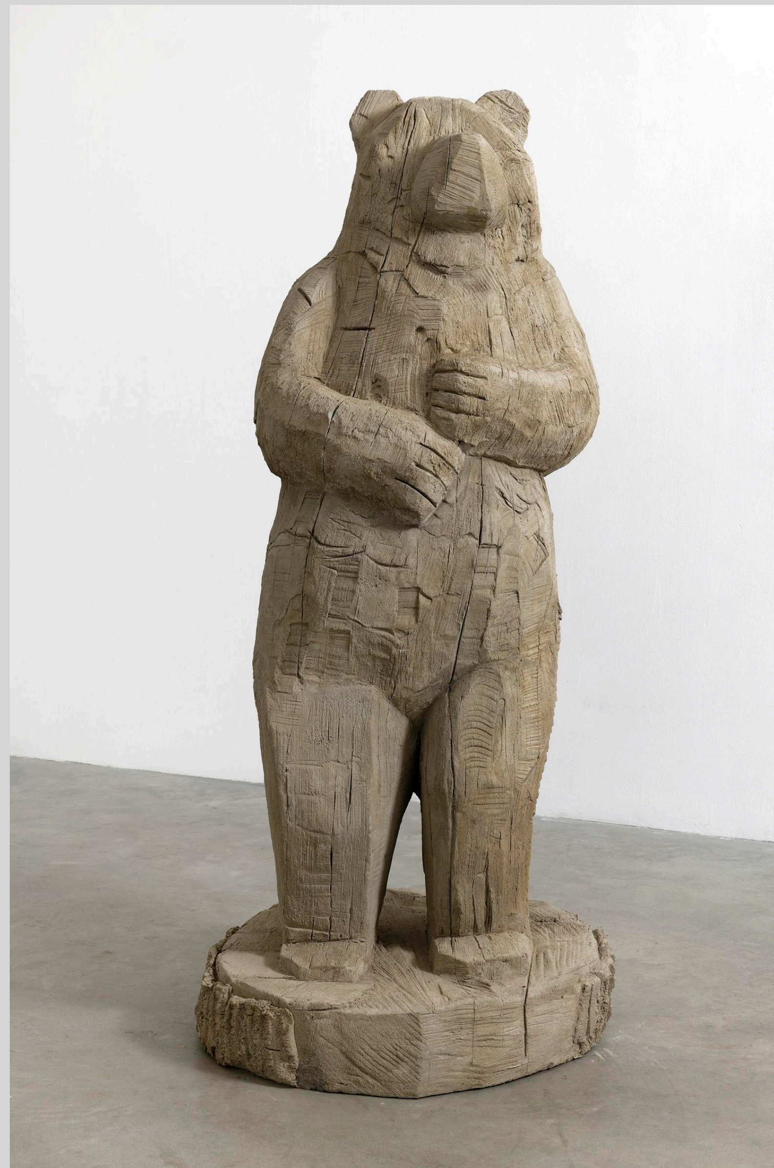
Ours aveugle , 2022, rusticage/ faux-bois, 143 × 63 × 63 cm