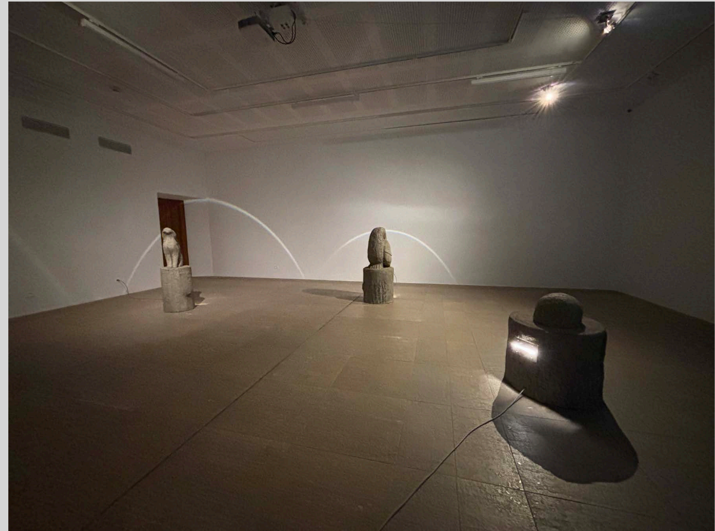
Lapin, Chouette, Hérisson , 2025, rustication/ faux-bois et lumière, installation à la Chapelle, Thonon-les-Bains, 128 × 45 × 44 cm, 126 × 53 × 55 cm et 76 × 66 × 62 cm