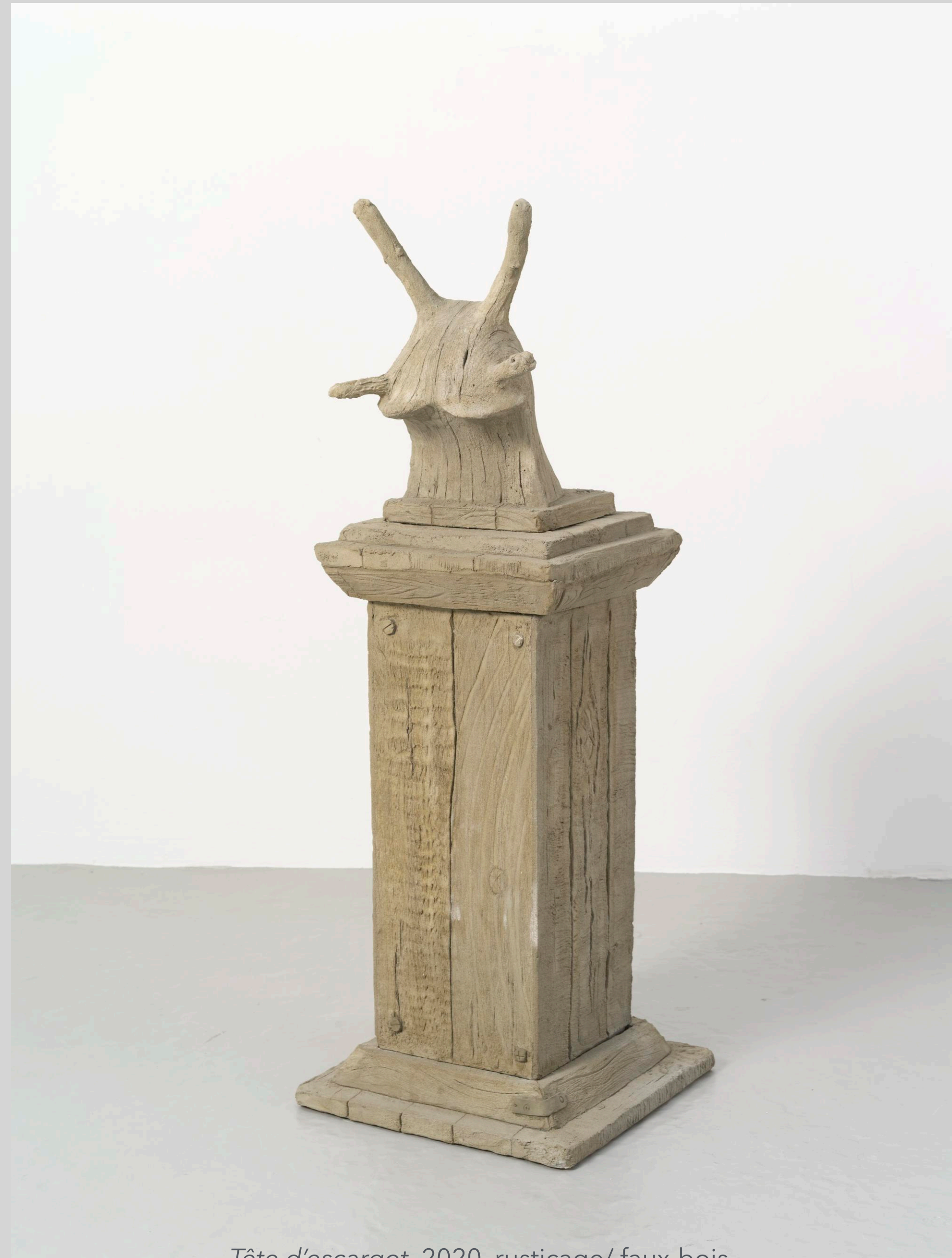
Tête d'escargot , 2020, rusticage/ faux-bois, installation, 143 × 50 × 56 cm