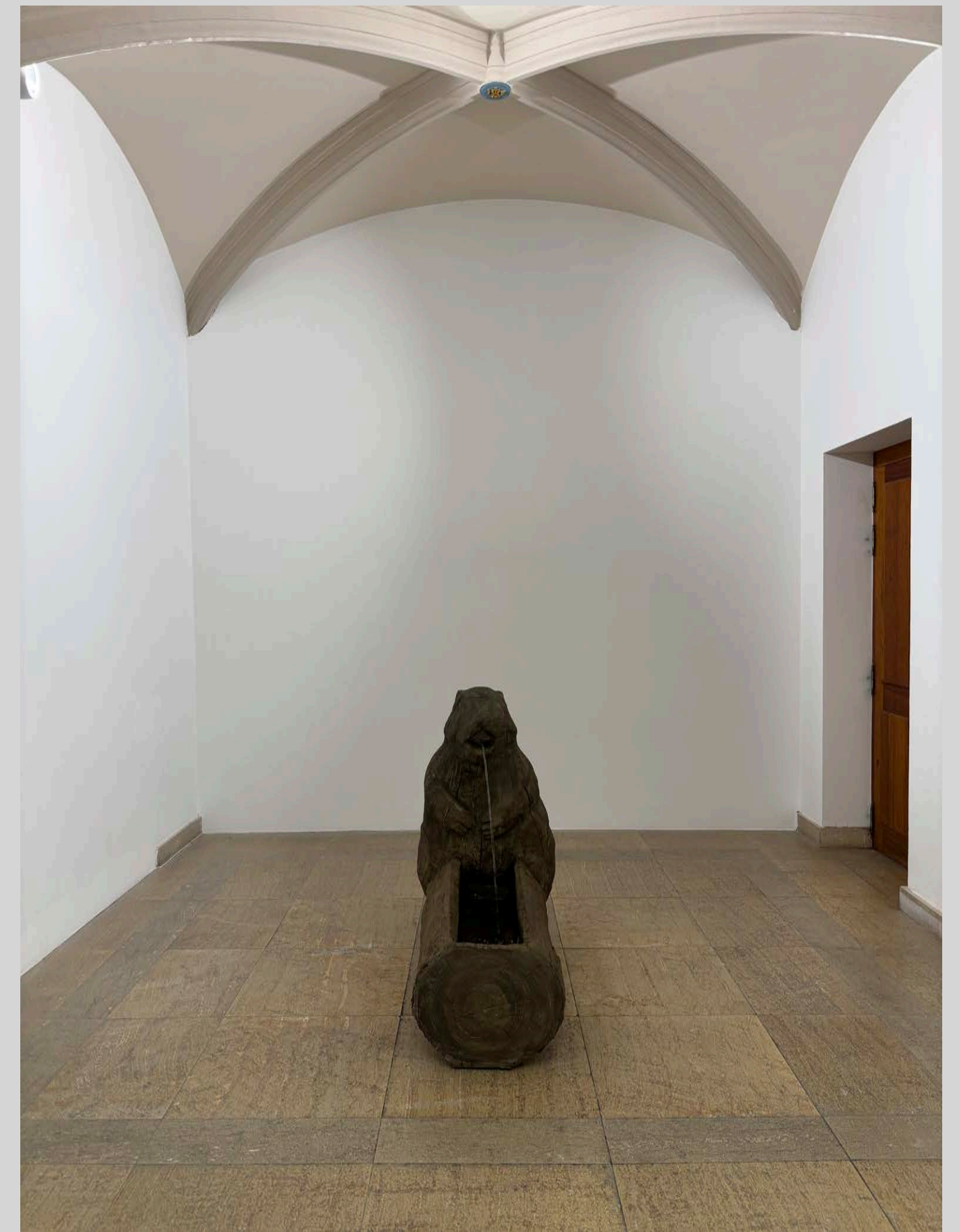
Installation à la Chapelle, Thonon-les-Bains