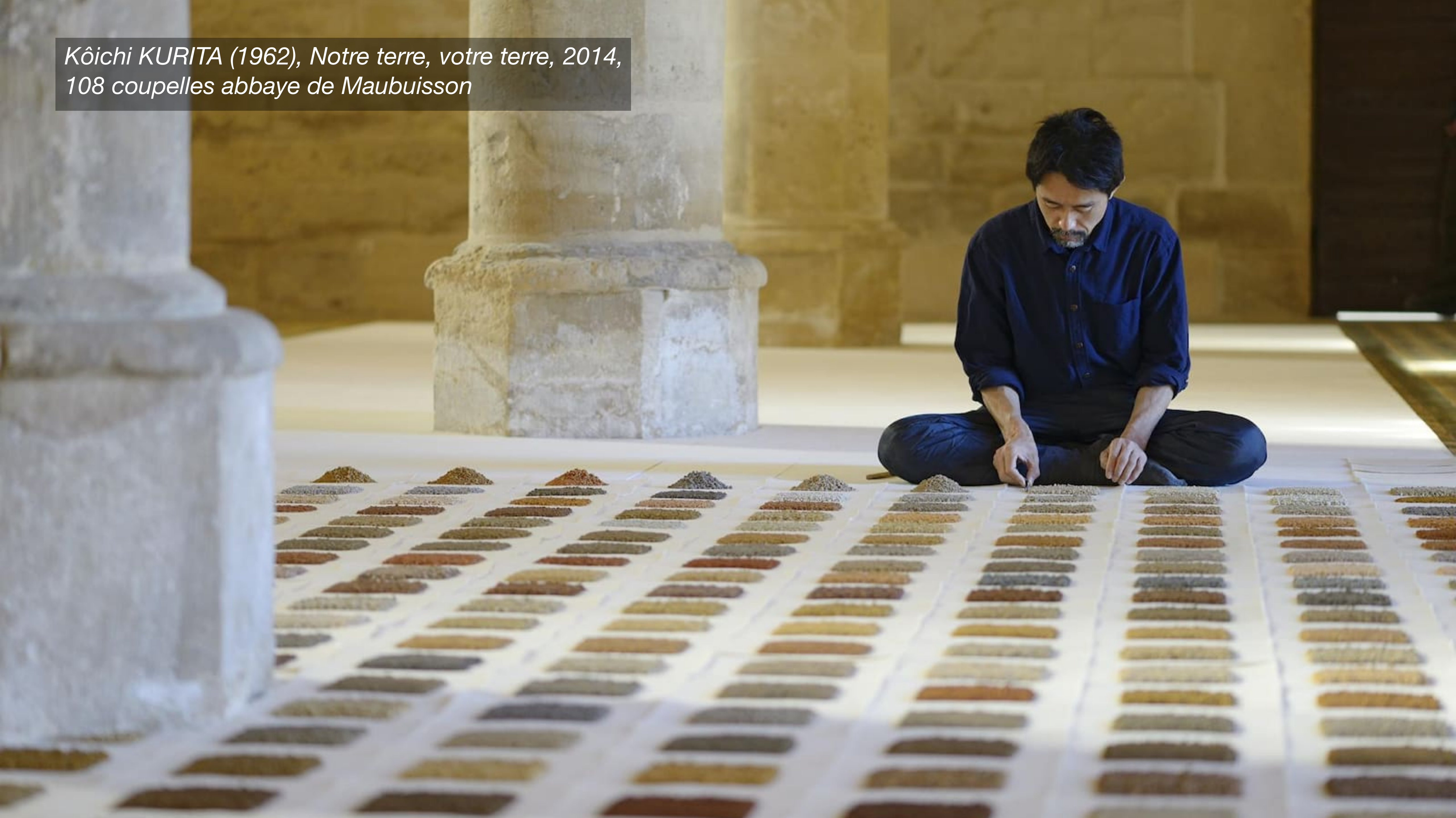
Kôichi KURITA (1962), Notre terre, votre terre, 2014, 108 coupelles abbaye de Maubuisson