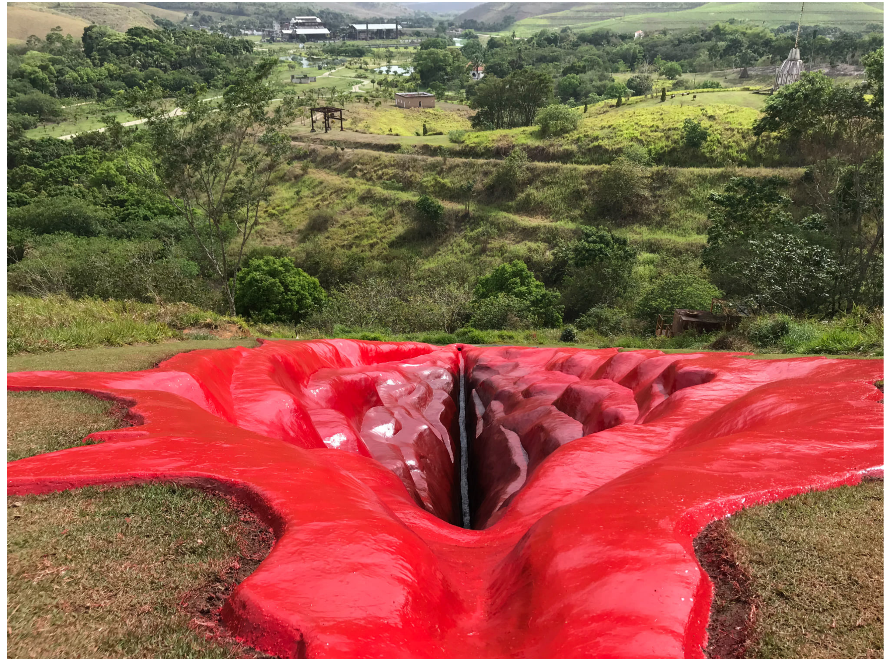
Juliana NOTARI, Diva, 2020, installation dans le parc artistique et botanique Usina de Arte, à Agua Preta, dans l'État du Pernambouc, au Brésil