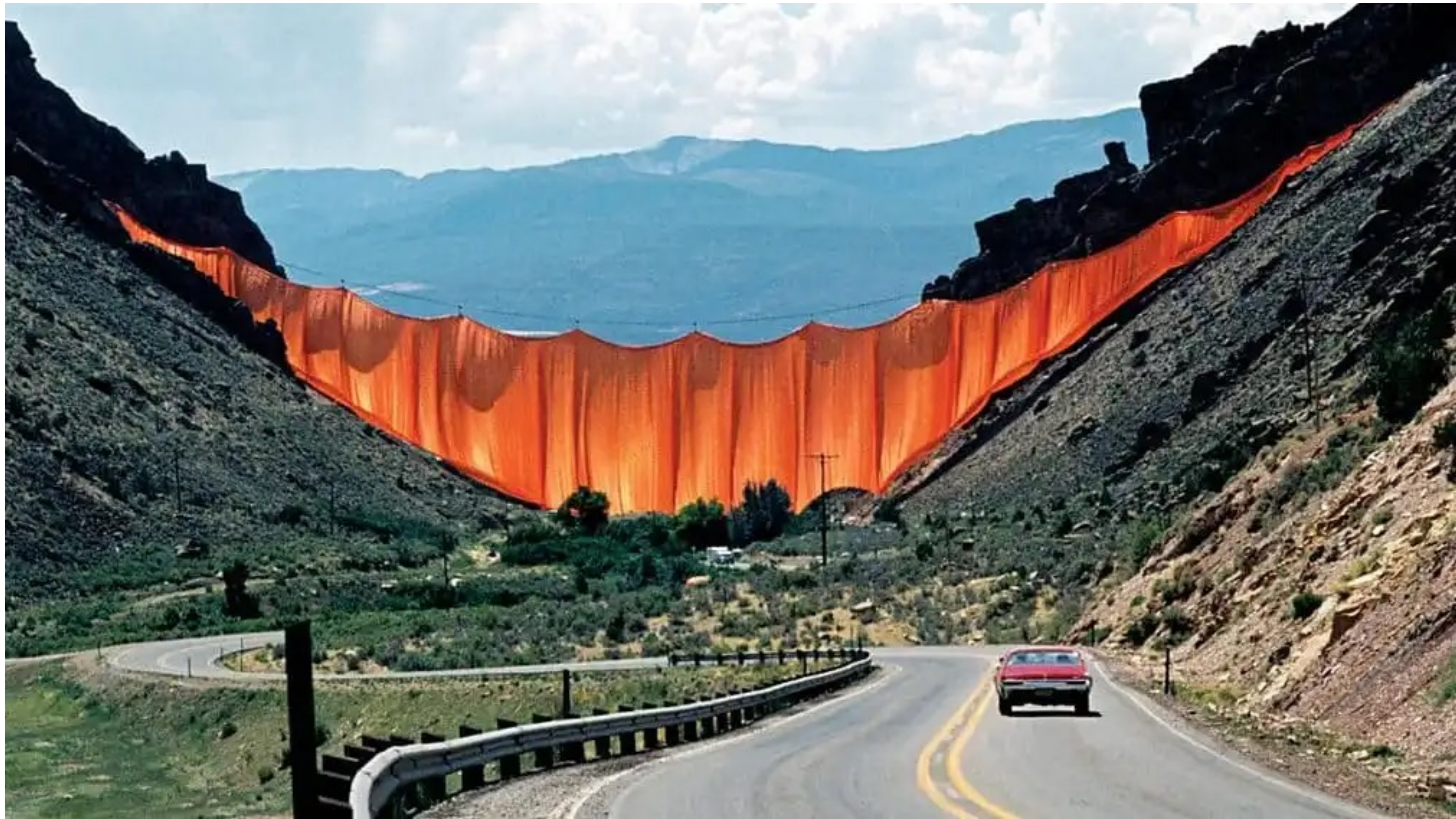
CHRISTO et Jeanne-Claude, Valley Curtain, Colorado, 1970-1972, installation large de 381 m, Rifle, Colorado