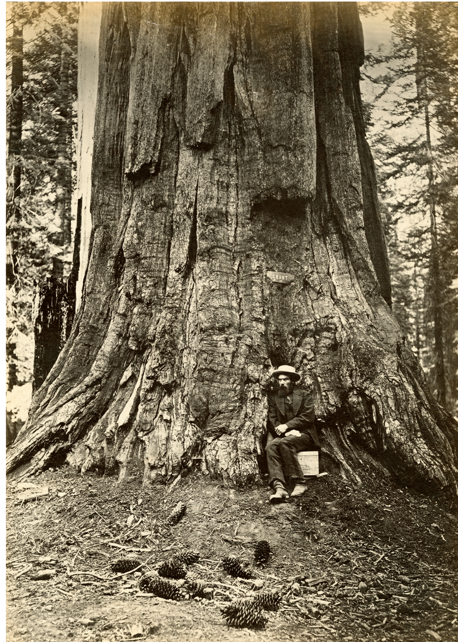
Carleton E. WATKINS, Eadweard Muybridge, Mariposa Grove, Yosemite, California, 1872, photographie, National Gallery of Art Library, Washington, DC