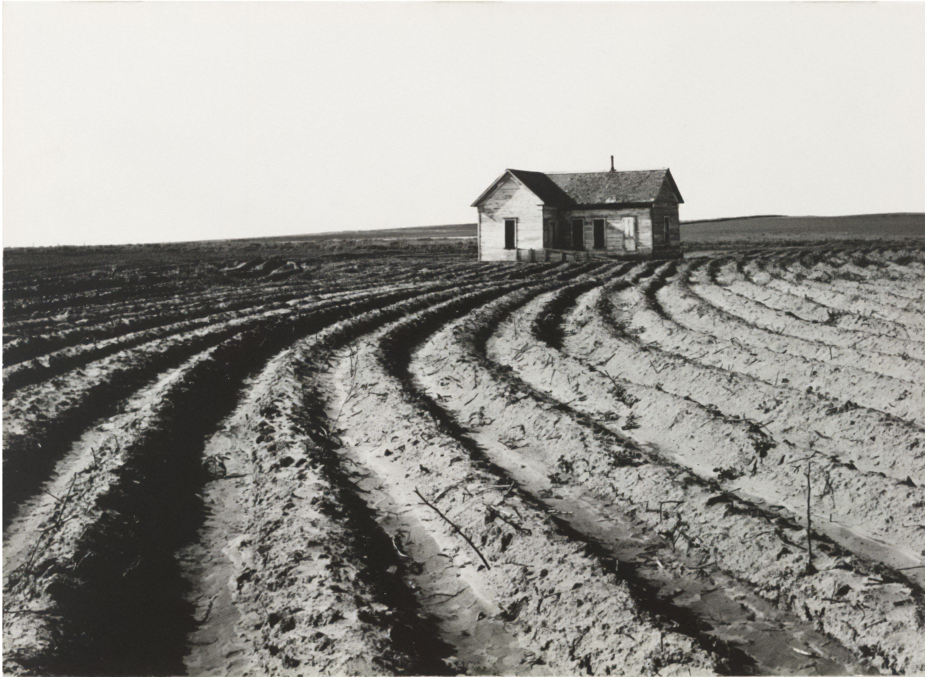
Dorothea LANGE, Tractored Out, Childress County, Texas, june 1938, Photographie, 23,6 × 32,6 cm, commandée par Farm Security Administration MoMA, New York