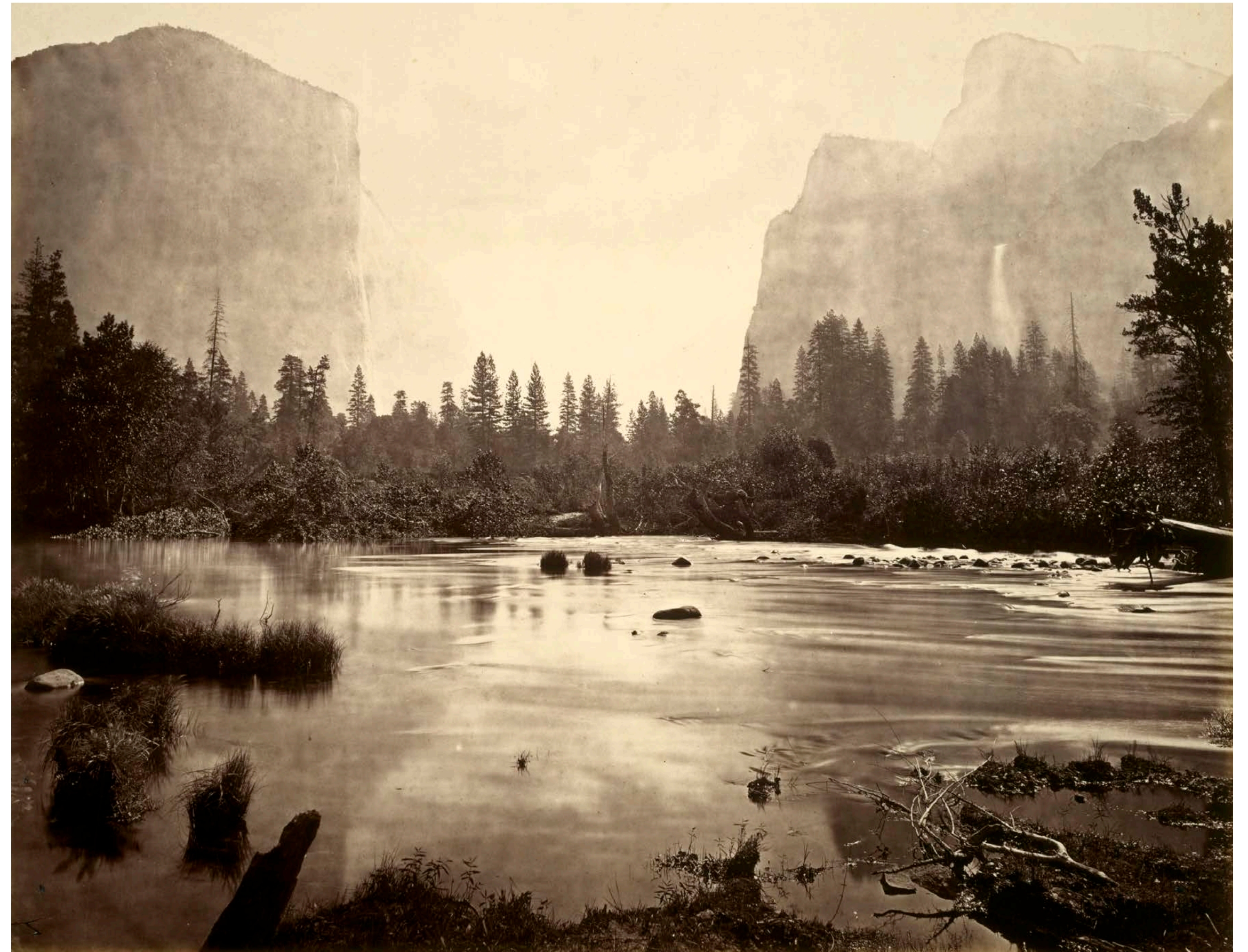
Eadweard MUYBRIDGE, Valley of the Yosemite, from Rocky Ford, 1872, photographie, 76,2 x 81,3 cm, The Cleveland Museum of Art, États-Unis