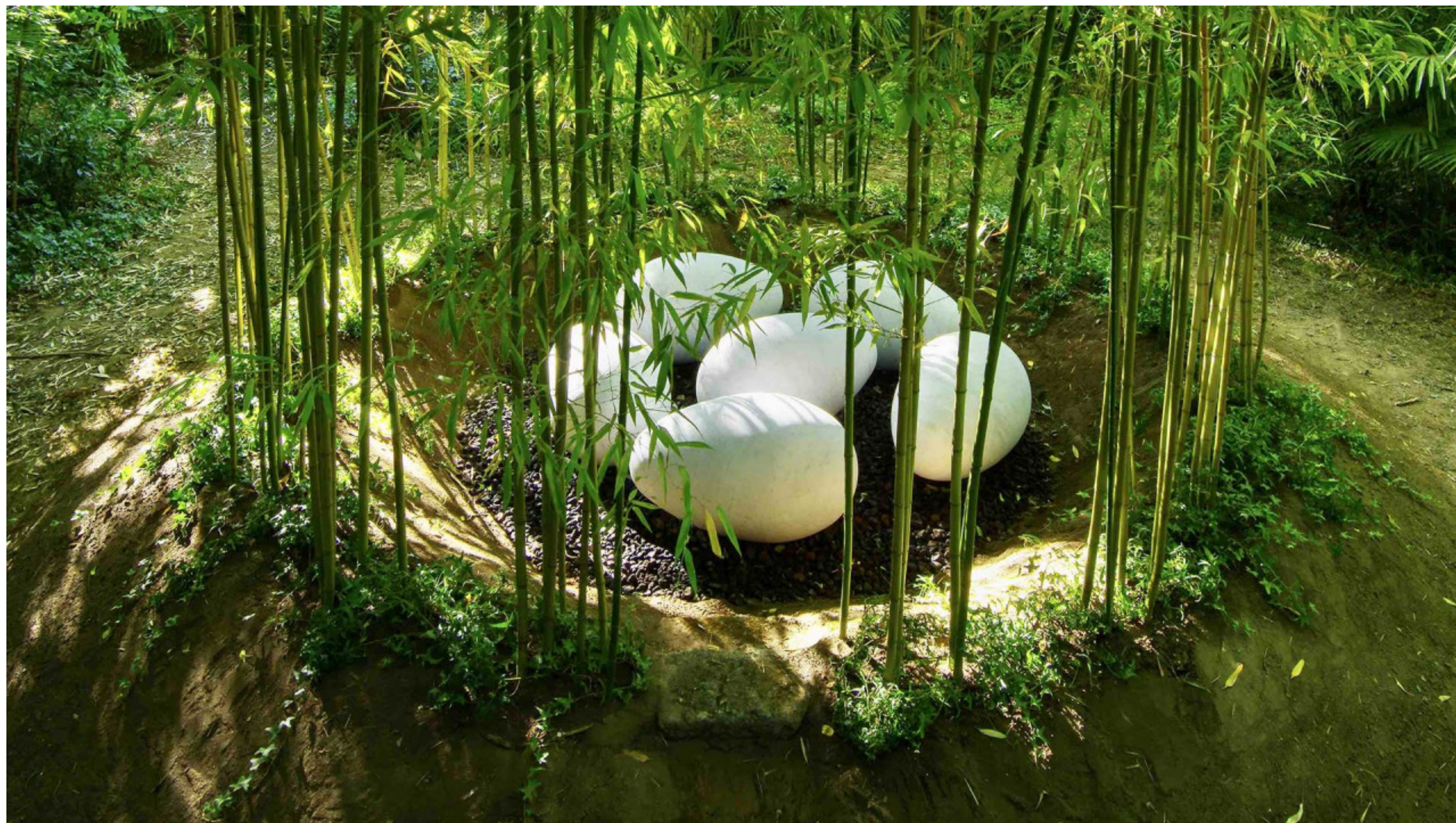
Nils UDO, La Clairière, parc du château de Lascours, 2022, terre, roche volcanique, marbre, bambous et lierres, impression pigmentaire sous Diasec, 200 × 150 cm