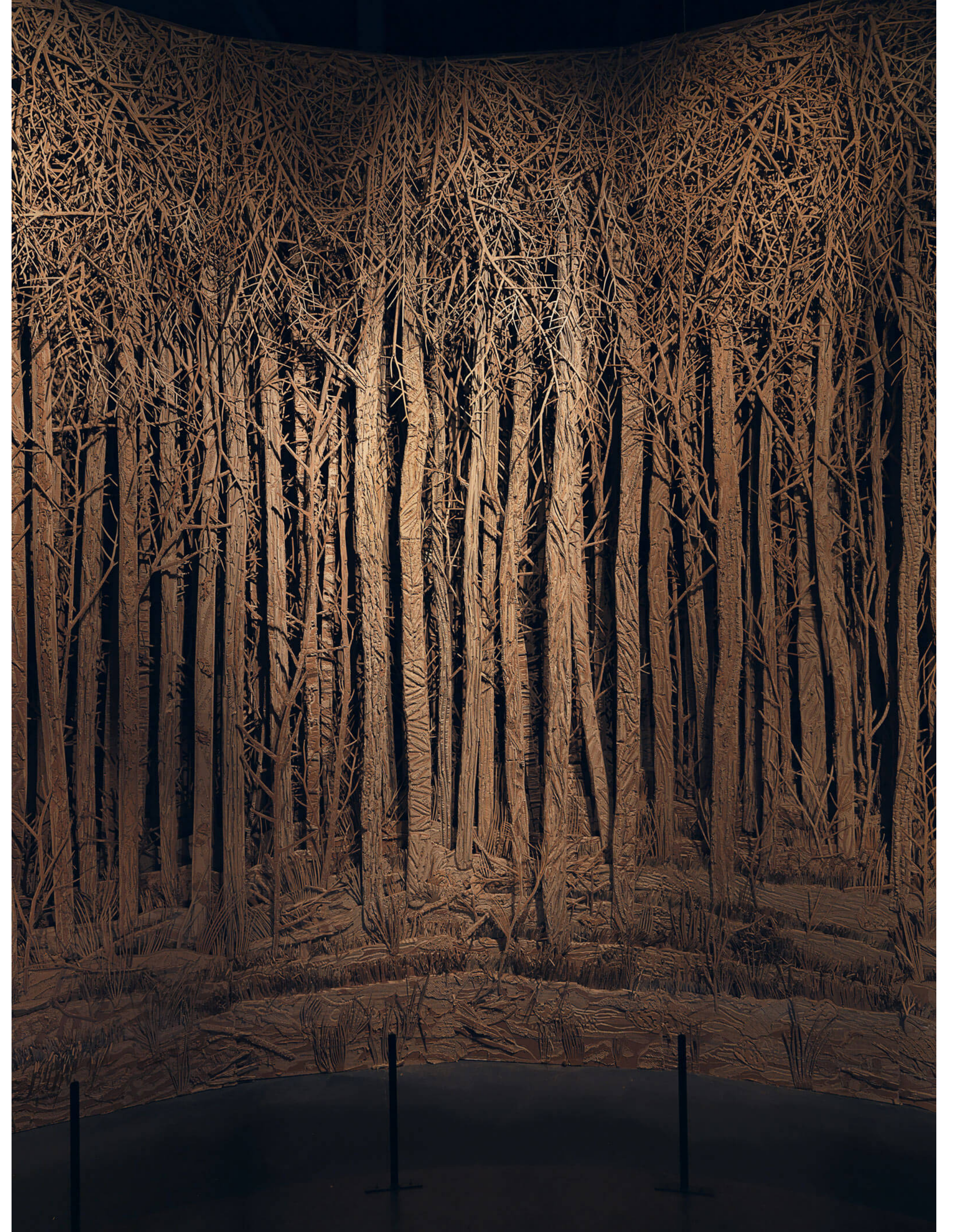
Eva JOSPIN, Panorama, 2016, installation, bois, carton et colle, hauteur 6 m, diamètre 13 m, Cour Carrée du Louvre