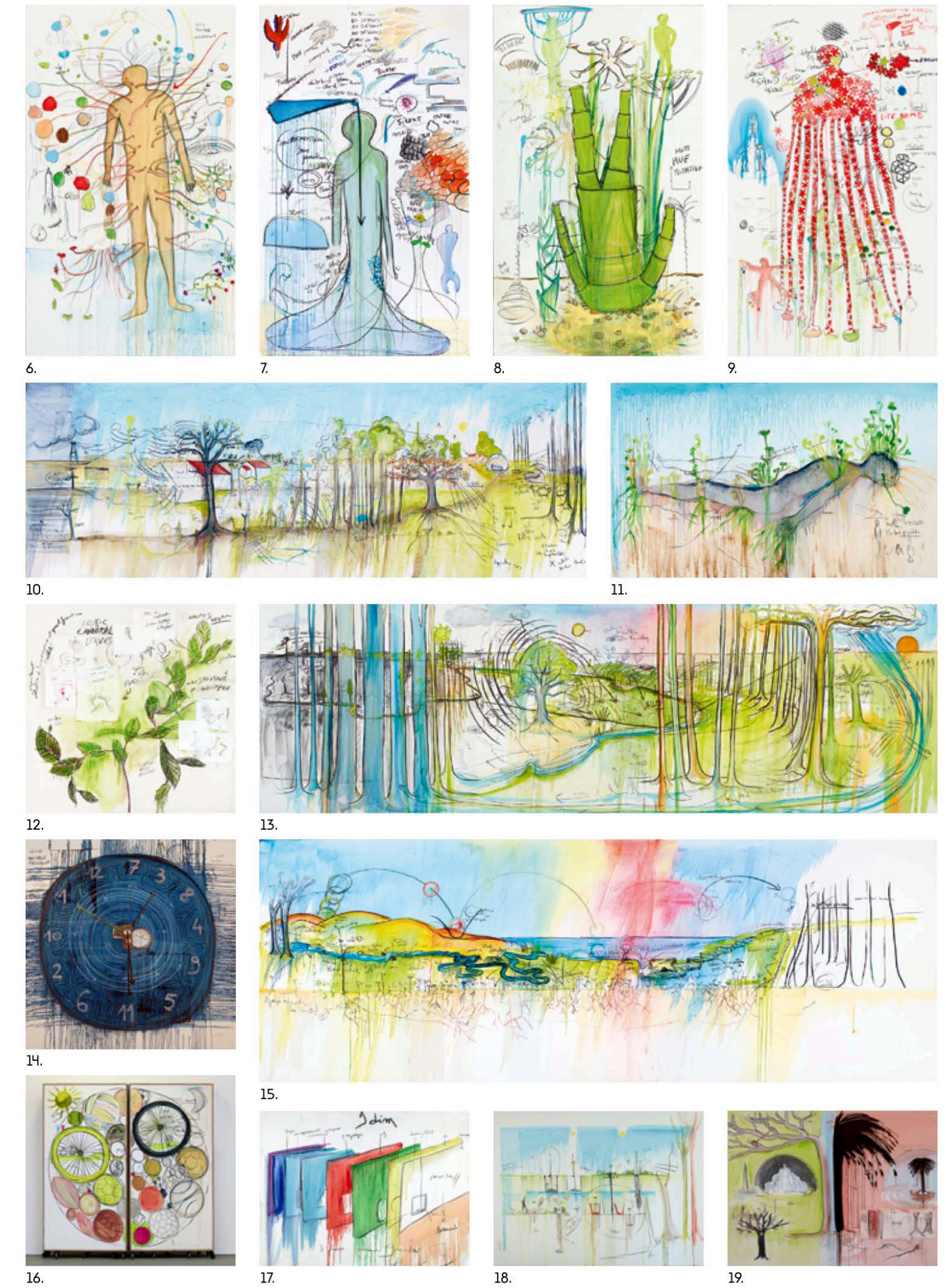
Fabrice HYBER, Paysage biographique, 2013, vue de l'exposition Nous les Arbres à la Fondation Cartier, Paris et visuels presse de La Vallée