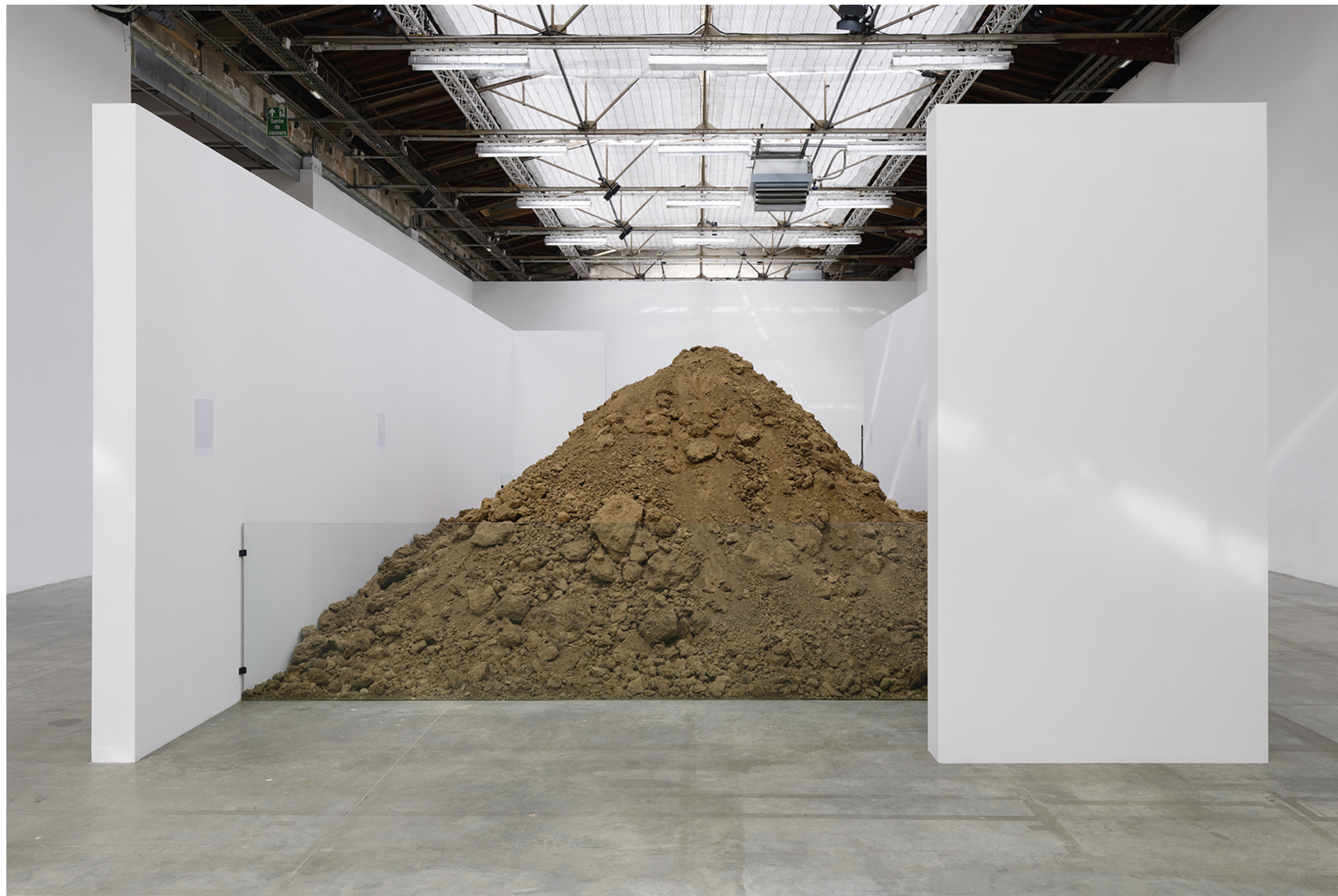
Maurice BLAUSSYLD, Espace inaccessible, 2010, installation, vue de l'exposition « Futur, Ancien, Fugitif », Palais de Tokyo, 2019