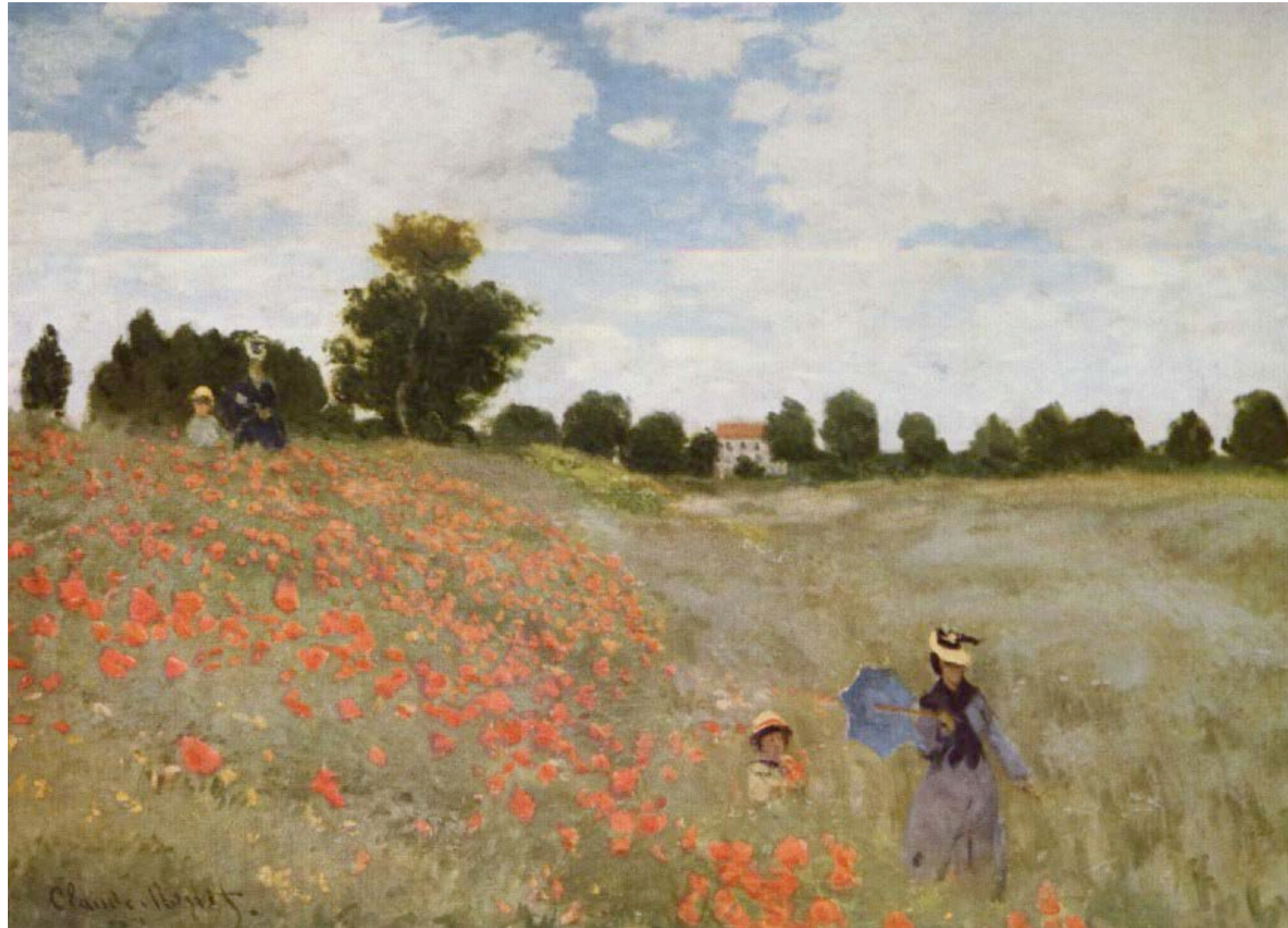
Claude MONET (1840-1926), Les Coquelicots, 1873, huile sur toile, 50 × 65 cm, Musée d'Orsay