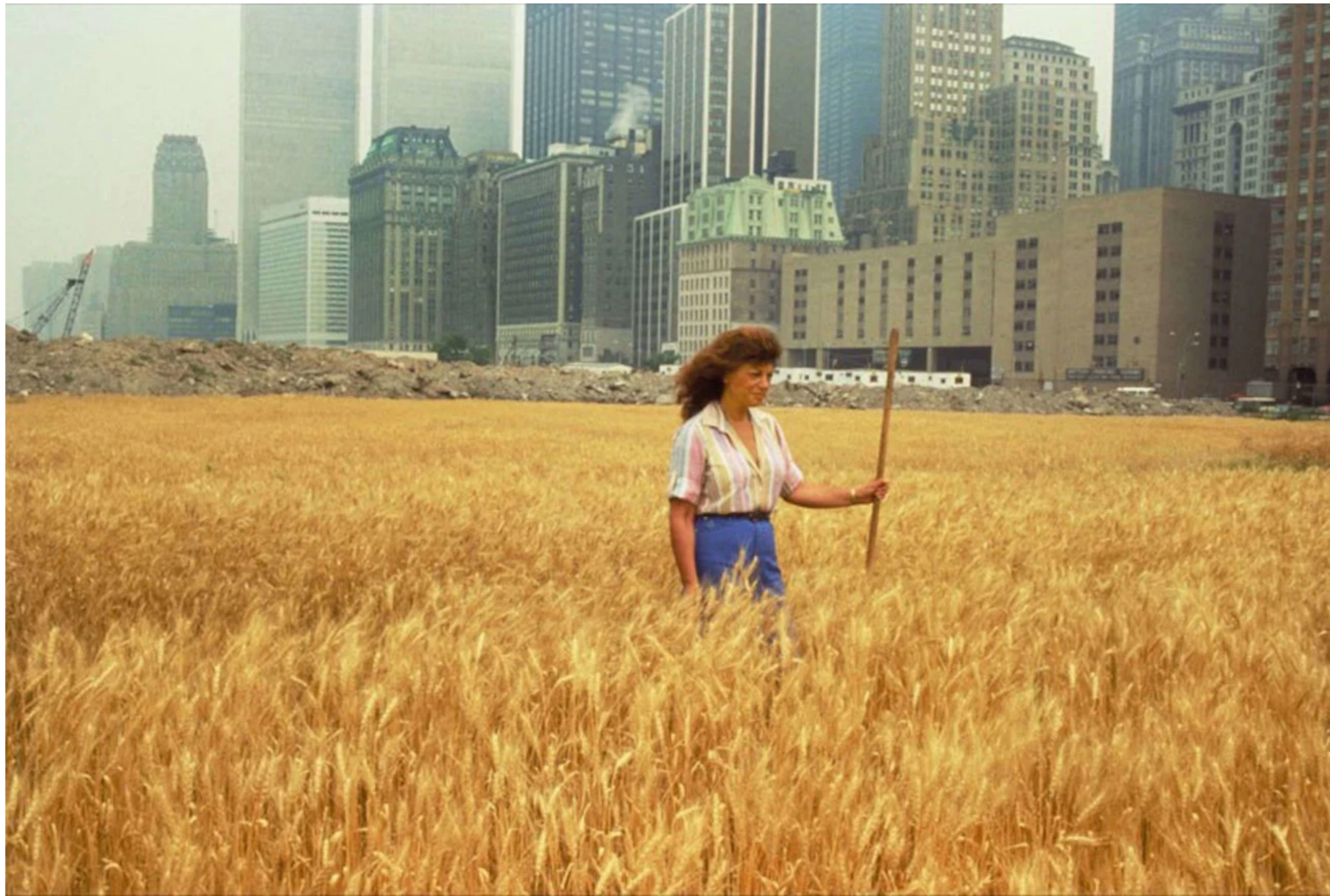
Ágnes DÉNES, Wheatfield - A Confrontation, 1982, commandée par l'association Public Art Fund Battery Park City, New York