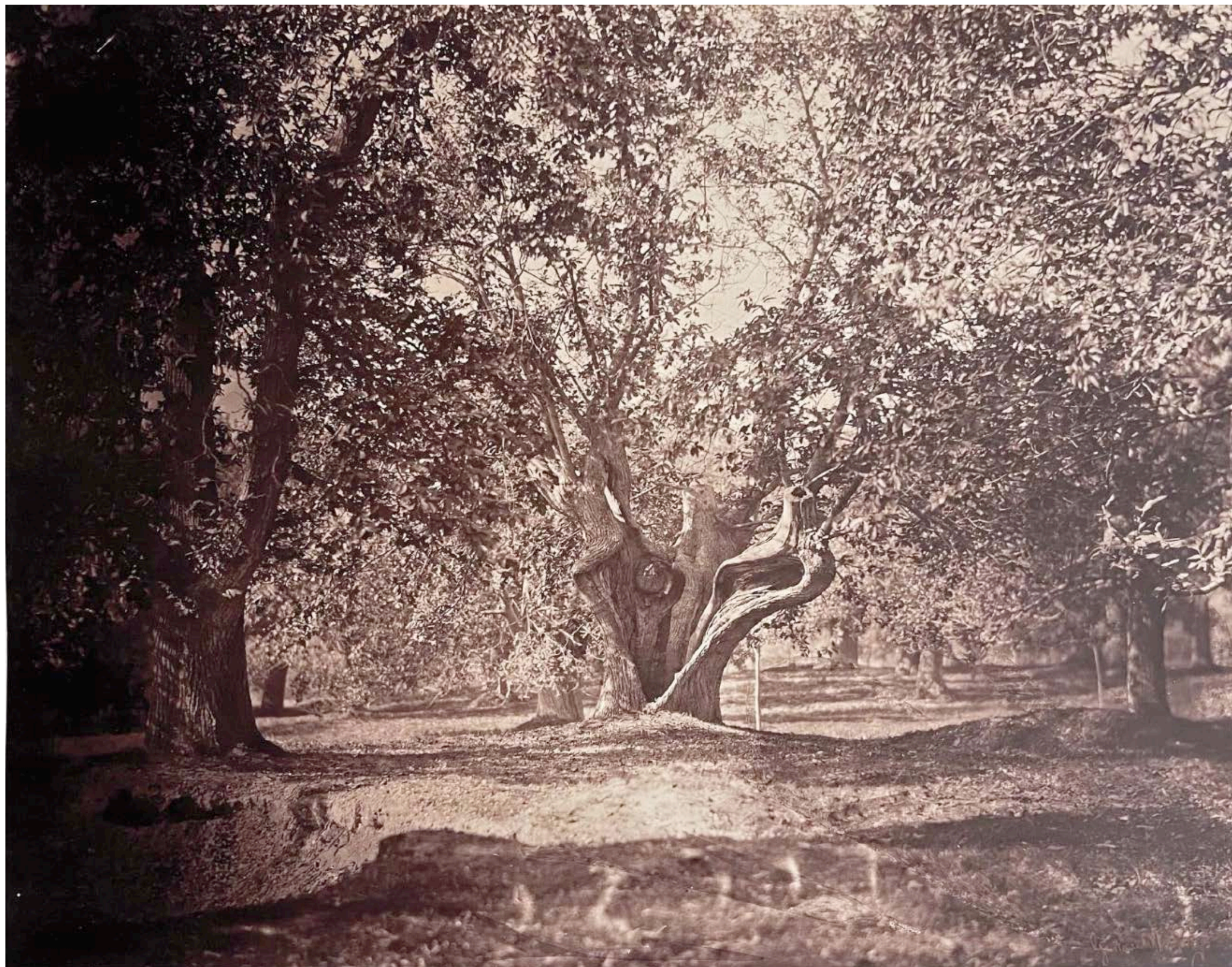
Gustave LE GRAY, Le Chêne creux, Fontainebleau, vers 1856, épreuve albuminée, 31,8 × 41,2 cm, collection privée