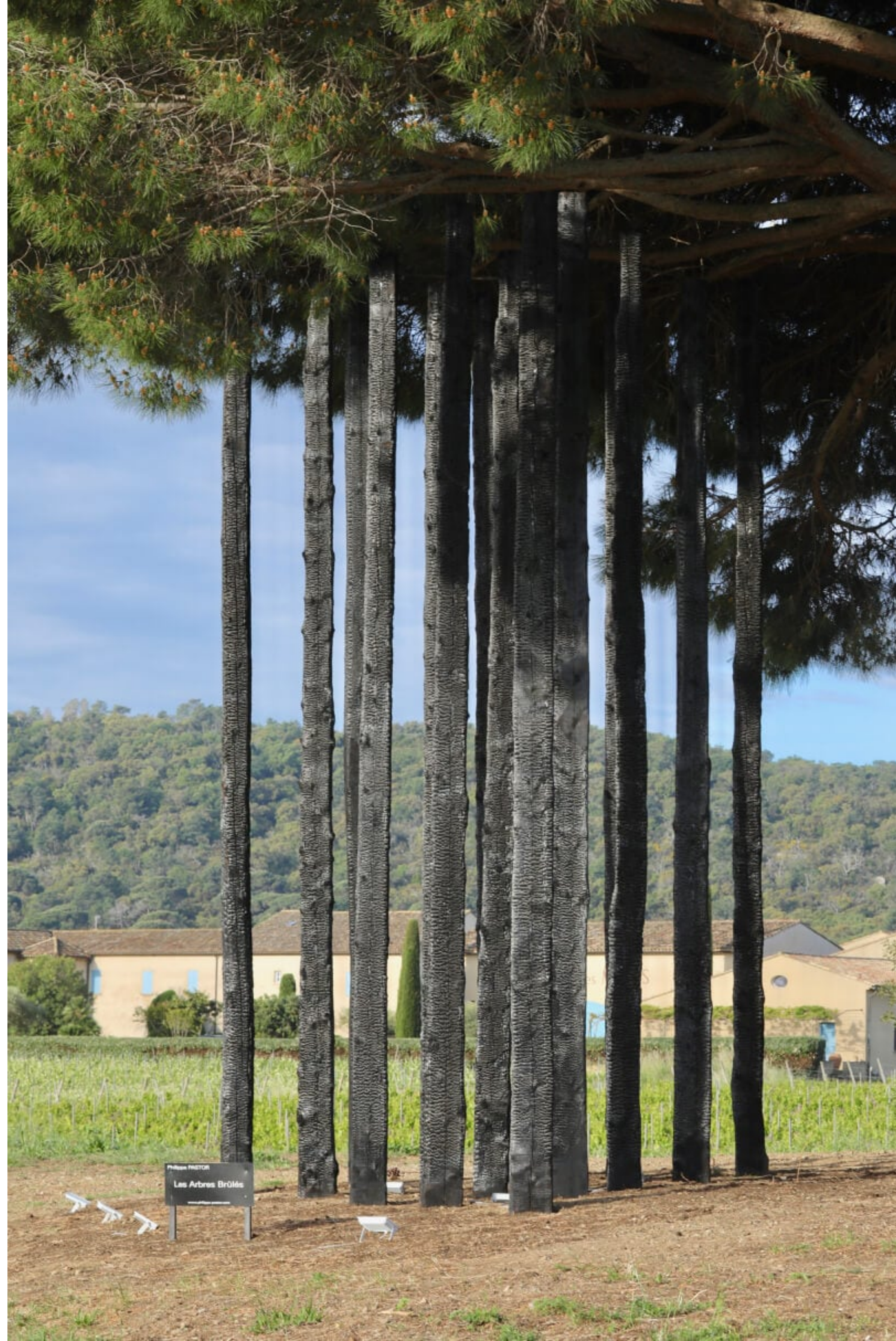
Philippe PASTOR, Les Arbres Brûlés, 2017–2018, installation permanente, Château des Marres, Golfe de Saint-Tropez