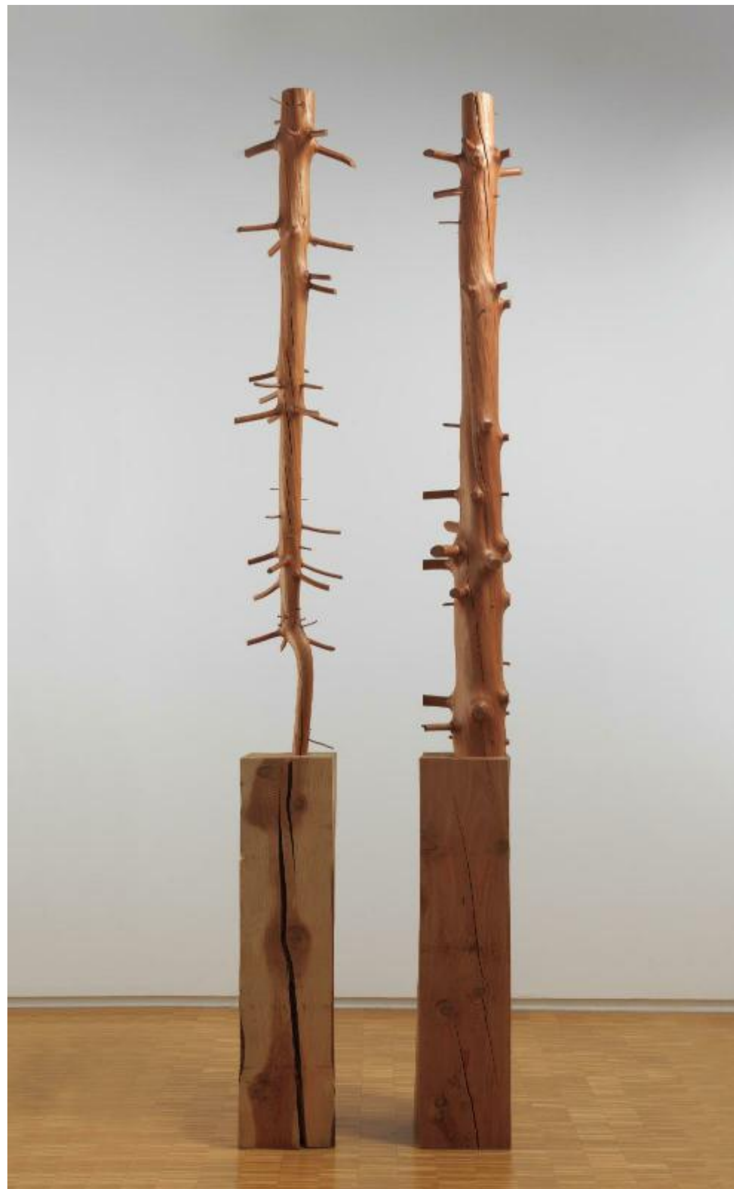
Giuseppe PENONE (1947), Albero di 7 metri (Arbre de 7 mètres), 1999, 1. 349 x 28,5 x 28,5 cm 2. 350 x 28,5 x 28,5 cm, Centre Pompidou