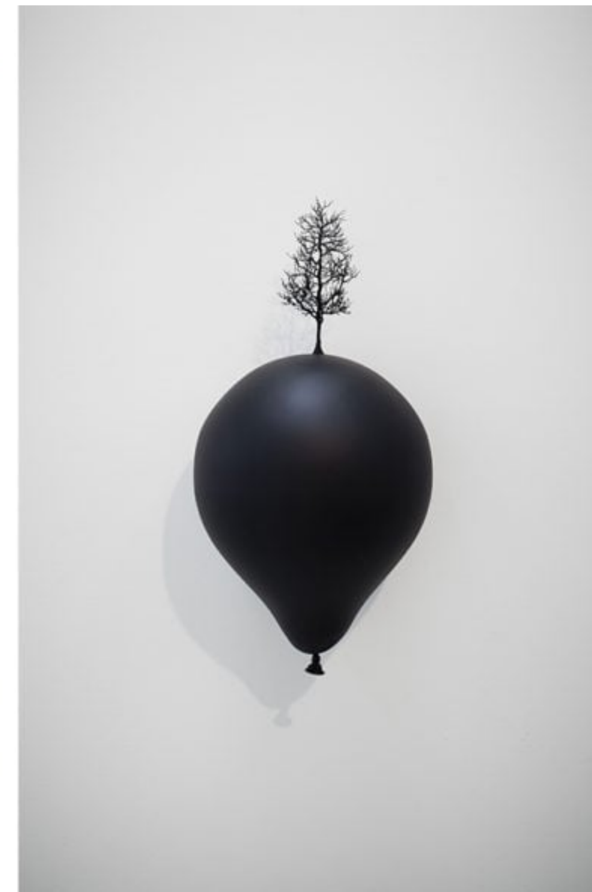
Kim MYEONGBEOM, à gauche, Deer, 2008 et à droite, Shadow planet, 2007 matériaux divers • 550 x 550 x 450 cm et 30 x 30 x 40 cm • Galerie Paris-Beijing