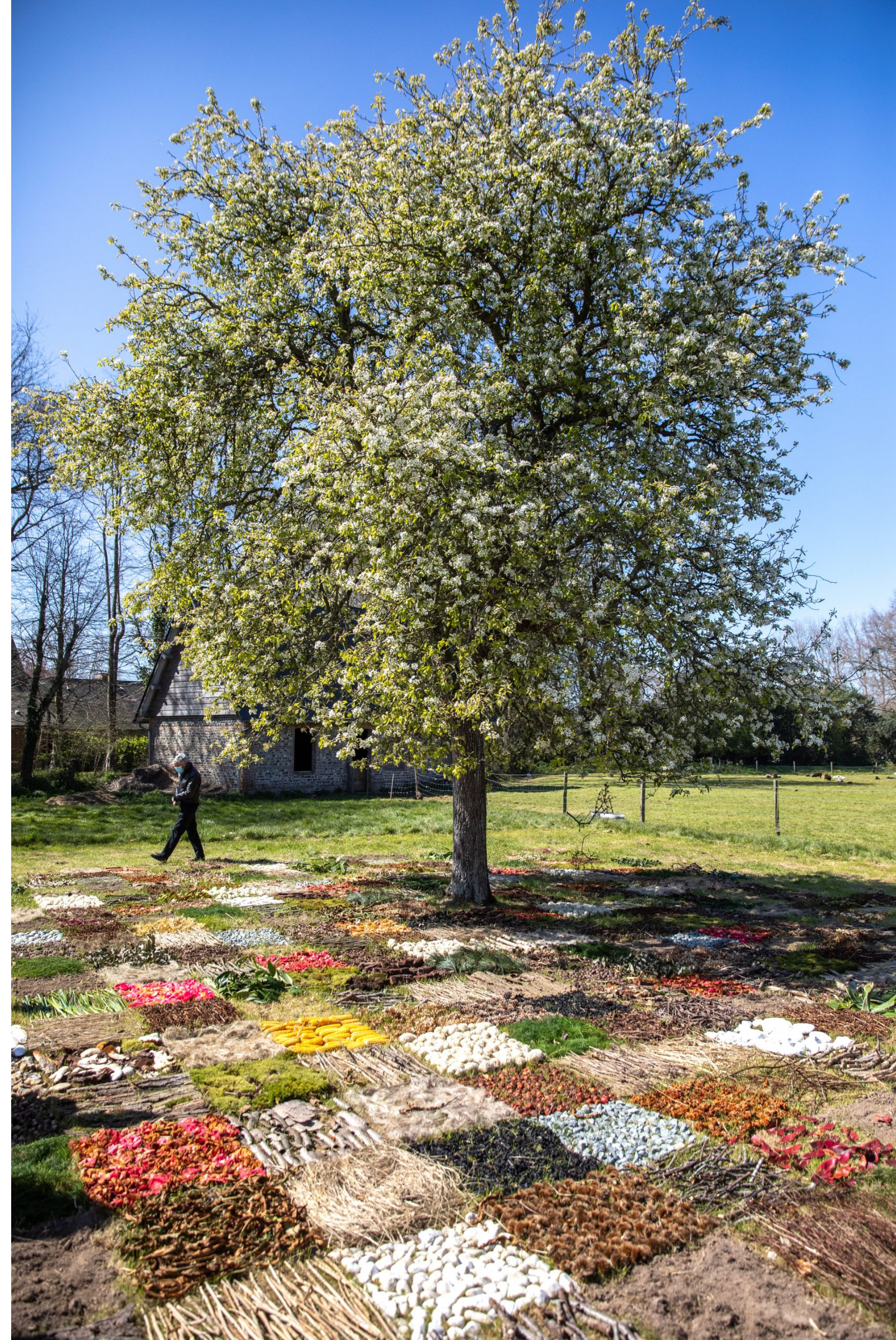
Michèle TROTTA, Damier, 2021, installation, Varengeville-sur-Mer